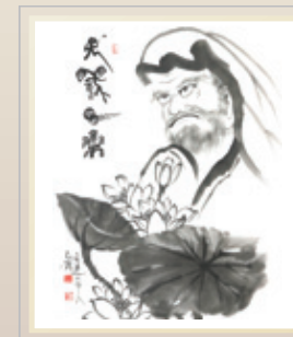
• 작품명 : 연꽃달마 • 사이즈 : 가로 30cm x 세로 45cm • 재 질 : 한지 먹 • 작가가 : 50,000원