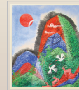
• 작품명 : 십장생 • 사이즈 : 가로 30cm x 세로 45cm • 재 질 : 한지 석재 혼합 • 작가가 : 300,000원

위 작품은 불사하는데 도움을 주기 위해 일체 서명한 선생님께서 기증하는 작품입니다. 아래 작품을 소장하시어도 불사에 크나큰 도움이 되겠습니다. 일체 선생님의 작품세계는 홈페이지 www.sycart.co.kr 에서 자세하게 보실 수 있습니다.