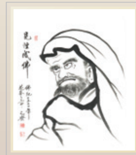
• 작품명 : 달마 • 사이즈 : 가로 30cm x 세로 45cm • 재 질 : 한지 먹 • 작가가 : 50,000원