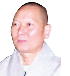
동국대 선학과 교수