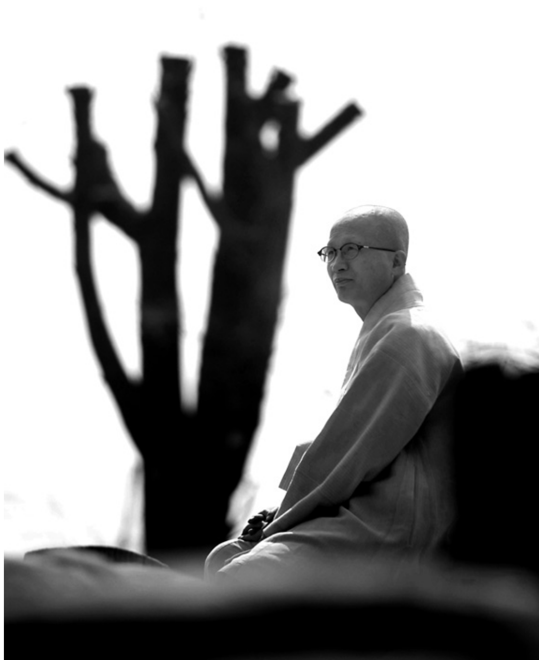
인터뷰 요청을 수차례 손사래쳤던 현장 스님은 자연인 자격으로 인터뷰를 하겠다고 응했다.

달맞이꽃이 있듯이 봄맞이꽃이 있는데 가장 봄을 먼저 맞는 꽃이 매화다. 한 겨울 매화를 보고 머지않