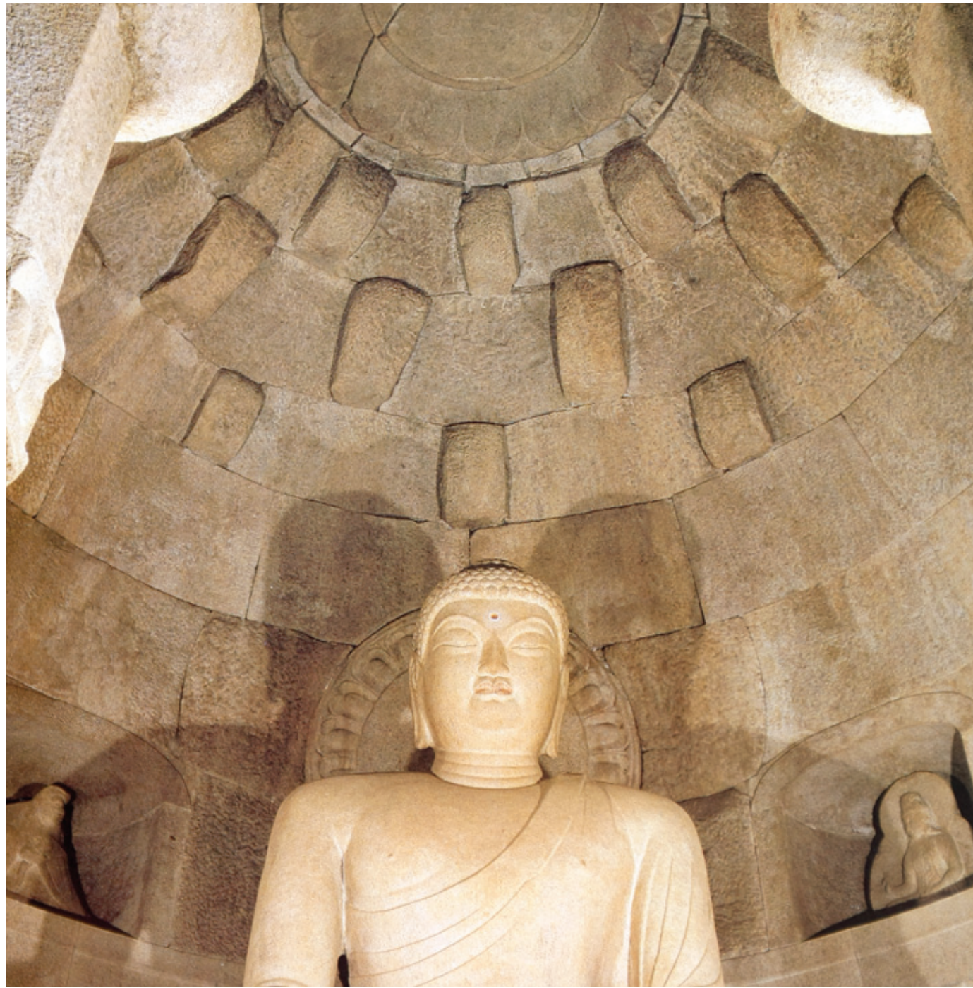
감실 위에서부터 5겹의 둥근 원형판석을 점차 줄이면서 궁륭형 천정을 축조하고 있는데 정 중앙에 연화문 원판으로 마감하고 있다. 이는 하중을 분산시키고 힘을 집중시켜 추락을 방지하는 치밀한 구조물이다.

의 너비와 높이 비율은 24:18로 4:3의 형태이다. 직사각형으로 따지면 1:1.4 비율인데 이는 선사시대부터 애호했던 안정된 비례로 통일신라시대 각 사원에도 적용되고 있다.