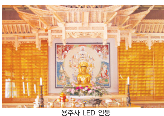
용주사 LED 인등