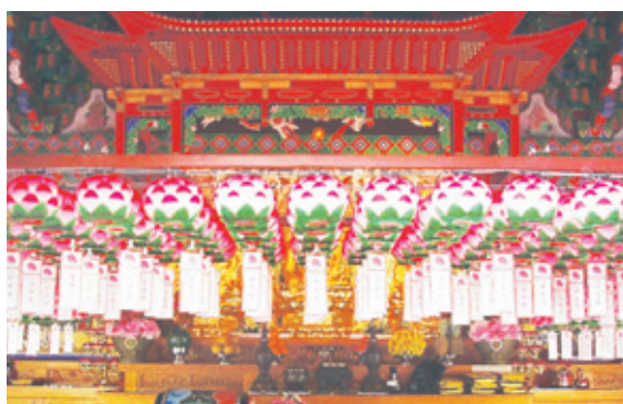
연등 자동 승강장치 _ 흥은사