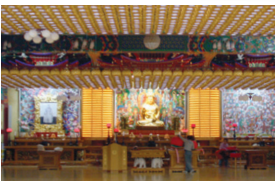
연등 자동 승강장치 _ 안산 월강사