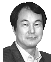
동국대 불교문화연구원 연구교수

당시의 농민, 무사 등 남녀노소가 석존의 제세시대를 그리워하는 의식을 행함으로써 삶을 불법으로 승화시키고자 한 것이다. 매년 2월 15일 열반회에 석존의 열반상과 16나한 등을 그린 그림을 걸어놓고 그가 스스로 지은 표백문(表白文)을 읽으며 이 4강식을 행했다. 묘에 상인은 석가세존에 대한 그리움이 사무친 나머지 몸을 떨며 그 자리에서 쓰러지기도 했다.