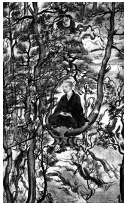
묘에 상인 수상좌선상(樹上坐禪像), 교잔지(高山寺) 소장, 국보

부터 인도로 직접 건너가 석가모니 부처님의 유적을 순례할 계획을 세웠으나 뜻을 이루지 못했다. 병이 나기도 했지만 일본을 떠나면 일본인들이 불법의 존귀한 가르침을 들을 수 없기 때문에 가서는 안 된다는 신념이 있었기 때문이었다. 묘에는 비록 인도에는 못 가지만 한 장의 종이에 <인도행정기>를 남겨, 인도까지의 거리와 도착하기까지의 시간 등을 상세히 기재했다.