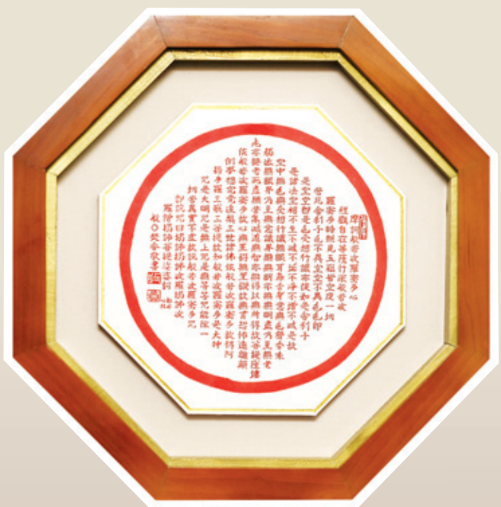
산승이 정성껏 사경한 반야심경사경 작품의 보시기는 불자님들께서 자율적으로 보내주시면 감사하겠습니다.

산승 반원 010-3599-6653 금산선원 : 부산시 사상구 감전 1동 122-39