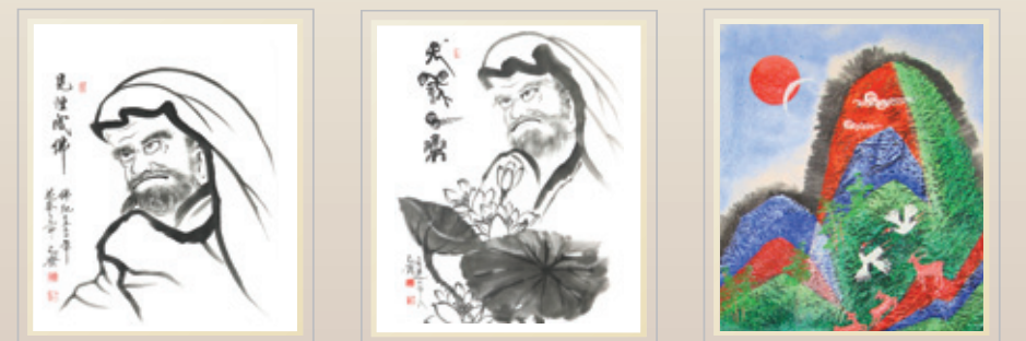
• 작품명 : 달마 • 사이즈 : 가로 30cm x 세로 45cm • 재 질 : 한지 금분 • 작품가 : 50,000원