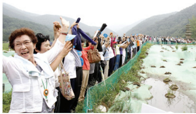
불자들이 보원사지에 함께 모여 내포 가야산 성역화와 보원사 복원을 서원했다.

신도들은 보원사지를 둘러보며 이번 성역화의 중요성을 가슴에 되새겼다. 토진 스님은 신도들에게 보원사지 주변을 둘러싸게 한 뒤 내포가야산 성역화와 보원사 복원을 함