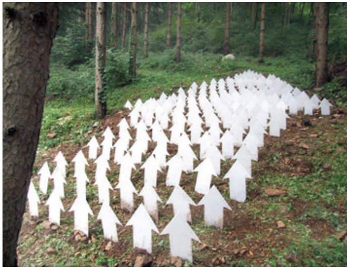
조은아의 '길없는 길' (2010 환경설치미술전 초대작)