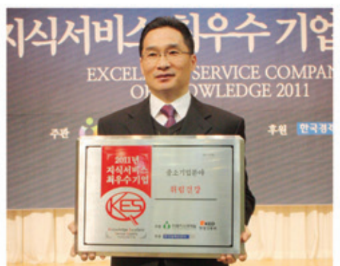
▲2011년 지식서비스 최우수기업 선정 사진

계좌번호: 국민 404601-01-046107 예금주: (주)휘림건강 판매원, 제조원: (주)휘림건강 * 대리점, 취급점, 영업사원모집