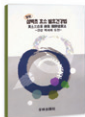
황토 삼백초 효소 발효건강법 부원출판사 | 김성복 지음 | 값 5,000원

노화와 난치병을 이기는 삼백초의 놀라운 효능! 변비, 숙변, 생리통을 없애는 날마다 기분 좋은 건강 비결! 간질환, 당뇨, 신장질환, 동맥경화, 고혈압, 심장병, 부인병, 비만치료!