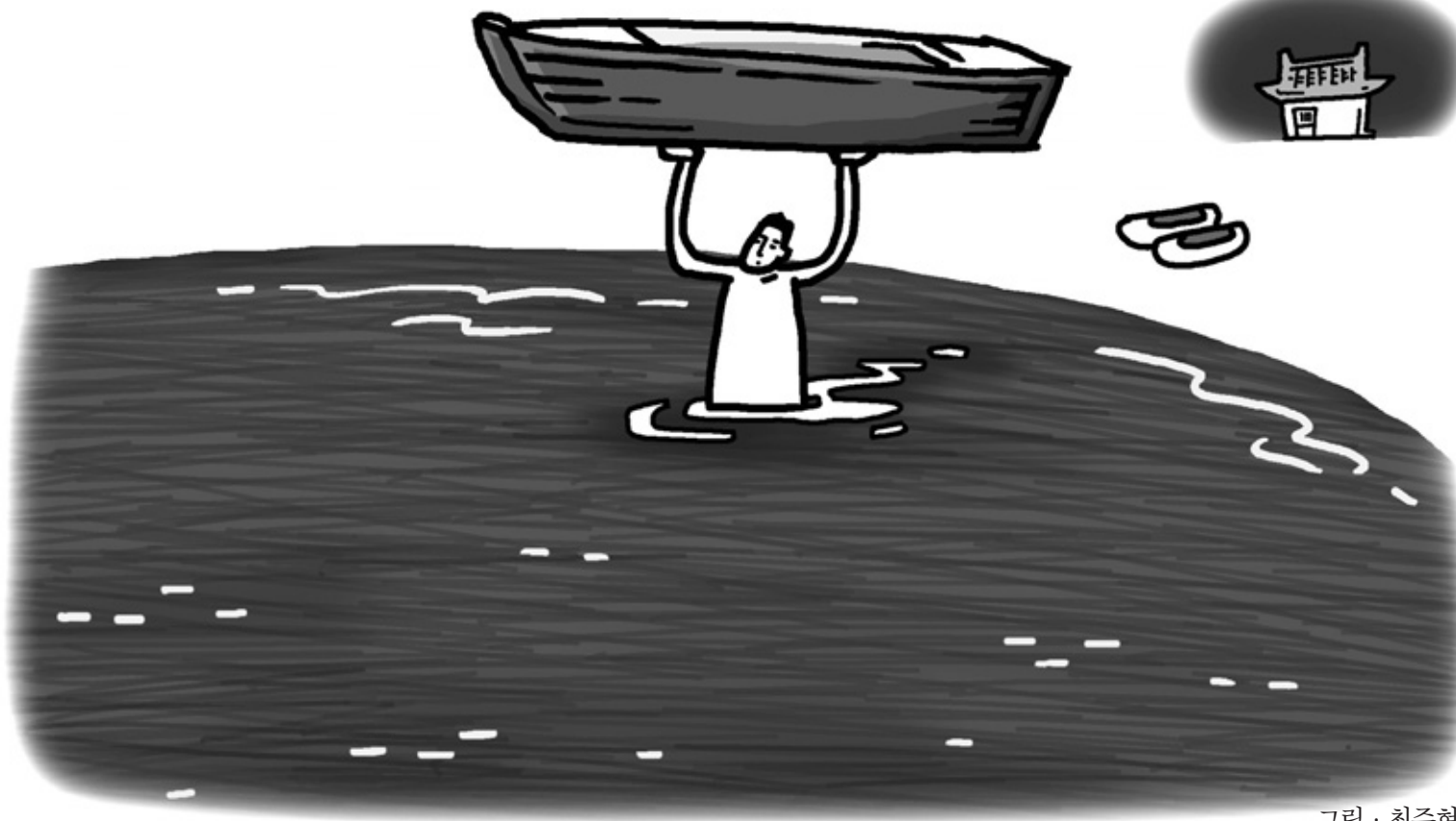
그림 · 최주현

어느 스님이 길을 가는데 까마귀 한 마리가 지저거리고 있더라고요. 무슨 소리를 하나 그러고