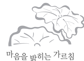
마음을 밝히는 가르침

대행스님 법훈록 그냥 무조건이야 양장본 / 211쪽 / 값 11,000원