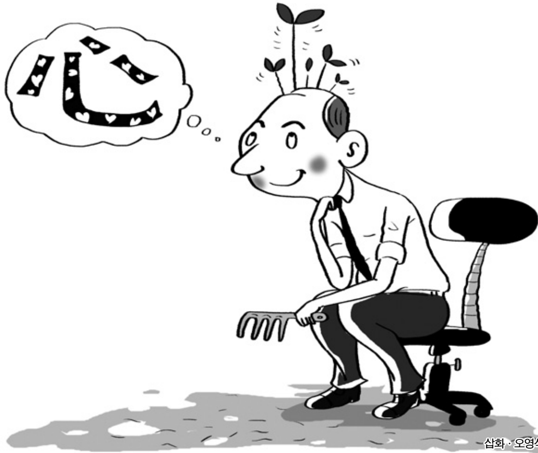
삽화 · 오영식

따라 마음 상태가 결정된다는 것이다. 모르고 있던 사실을 알면 마음의 상태는 분명 변한다. 또 아는 게 달라지면 마음뿐만 아니라 우리의 현실적 삶도 달라진다. 삶의 변화를 원한다면 우선적으로 마음의 변화가 있어야 한다. 또 마음의 변화를 위해서는 다시 보고 아는 것이 달라져야 한다. 그렇다면 보고 아는 것이 달라지면 어떻게 해야 하는가. 보고 아는 방식을 바꾸면 된다. 스님이 제안하는 클리어 마인드&클리어 라이프 전략의 원리는 간단하다. 우선 보고 아는 방식을 바꿔 우리가 알아야 할 당연한 사실을 바로 깨닫게 한다. 그리고 깨닫는 순간 마음의 변화가 일어나며 마음의 변화가 어떻게 생활의 변화, 삶의 변화로 이어지는지 과정과 원리를 살핀다. 생각은 순식간에 바뀐다. 우린 화가 났다가도 친구의 진한 장난에 갑자기 웃기도 한다. 스님은 이제까지 봐야 할 것이 무엇인지 몰라, 보지 못했던 것에 대해서 보는 요령을 가르쳐 준다. 스님은 우선 일어나는 마음, 일으키는 마음이 있다는 사실을 구별 짓는 법을 설명한다. 다 내 마음이고 내가 일으킨 것 같은데 알면 알수록 그것은 일어나는 마음 상태일 때가 대부분이다. 일어나는 마음의 7할은 대부분 부정적이고 자기중심적인 것들이다. 부정적으로 일어나는 마음들은