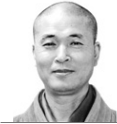
석우 스님의 조주록 선해 <73>