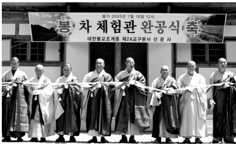
7월 18일 선운사 석상마을 입구에서 봉행된 차 체험관 완공식에서 스님들이 테이프커팅을 하고 있다.

한편 선운사는 수행과 포교, 복지와 문화 공동체를 지향하며 활발한 지역복지 사업을 펼치고 있다. 현재 고창군 종합사회복지관, 노인복지회관, 노인복지센터 등 지