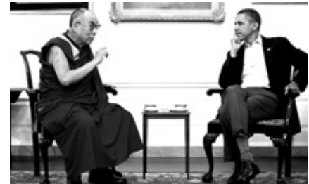
달라이라마(사진 좌)와 오바마 대통령

달라이라마와 버락 오바마 미국 대통령이 7월 16일 백악관 맴룸에서 환담을 나눴다.