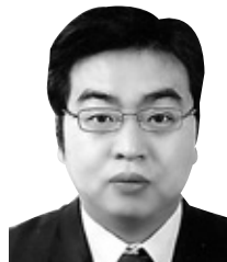
동국대 불교사회문화연구원 전임연구원

하지만 불국사는 부처님의 나라를 세우고자한 신라인들의 마음은 종파를 넘어 이 이상의 의미를 담고 있다. 수많은 사상을 엮고 세월을 더해가며 구축해 놓은 그들의 세계는 토함산을 불국토로 만들려고 하던 신라인들의 이상 9품인(九品印) 중에 하품중생인(下品中生印)을 보이며, 양손의 위치에 있어서 좌우가 서로 바뀐 것은 국보 제26호 비로자나불좌상에서도 보이는 공통된 점이다. 불국사 비로전에 모셔져 있는 비로자나불은 177cm로, 얼굴은 위엄이 있으면서도 자비로운 인상을 풍긴다. 왼쪽 어깨에만 걸쳐 입은 옷은 매우 얇게 표현돼 당당한 신체의 굴곡을 그대로 보여주고 있다. 손모양은 오른손 검지를