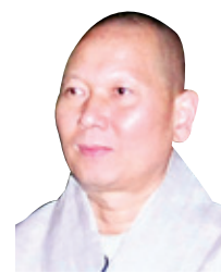
동국대 선학과 교수