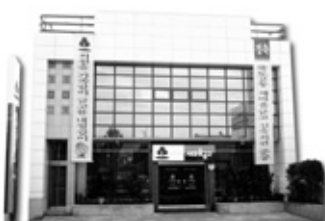
형산새마을금고 본점 전경