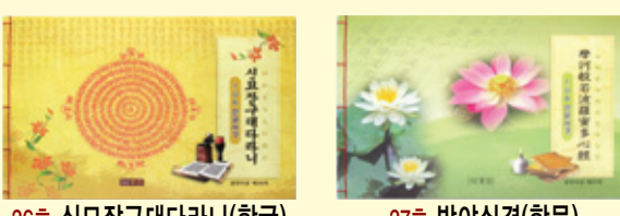
26호 신묘장구대다리(한글) 27호 반야심경(한문) 28호 대불정능엄신주(한글) 29호 쑤부다라니(한글) 30호 반야심경(한글)