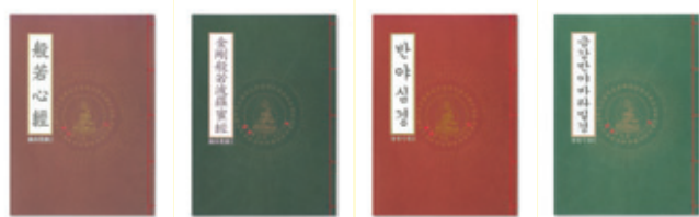
1호 반야심경(한문) 2호 금강경(한문) 3호 반야심경(한글) 4호 금강경(한글)

할인가 3,500원(50권 이상) 정가 5,000원(1권) • 내 지 : 70장 자연색메트지 • 제 본 : 한장본 실제본