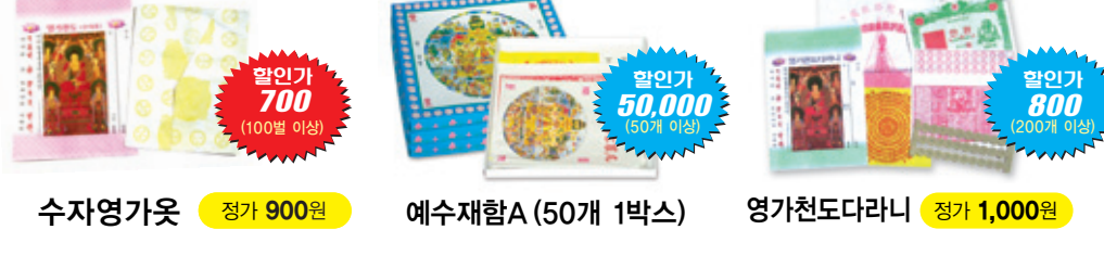
수자영가웃 정가 900원 예수재함A (50개 1박스) 할인가 700 (100벌 이상) 영가천도대라니 정가 1,000원 할인가 50,000 (50개 이상) 할인가 800 (200개 이상)