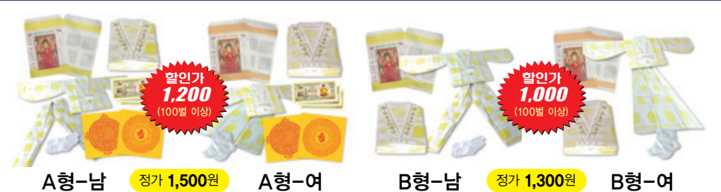
A형-남 정가 1,500원 A형-여 할인가 1,200 (100벌 이상) B형-남 정가 1,300원 B형-여 할인가 1,000 (100벌 이상)