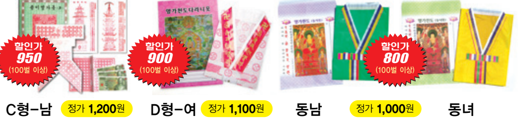
C형-남 정가 1,200원 D형-여 정가 1,100원 동남 정가 1,000원 동녀 할인가 950 (100벌 이상) 할인가 900 (100벌 이상) 할인가 800 (100벌 이상)