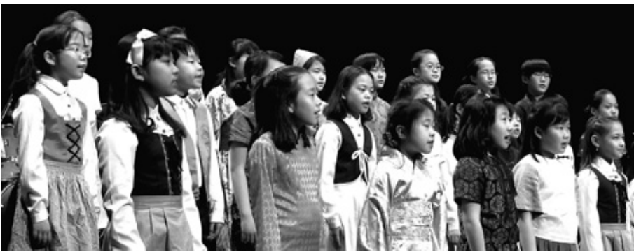
아이들은 문화교육활동을 통해 학교에서 채워지지 않는 인간관계, 심적 유연성, 심리적 안정감, 자선감 회복 등을 갖게 된다. 사진은 다문화 가정의 아이들로 구성된 레인보우합창단의 공연 모습이다.

다문화자녀는 다문화 1.5세대, 2세대로서 자신의 의지와 상관없이 다문화가정에 태어난 자녀들이다. 이들에게는 자라나면서 외부의 따가운 시선과 눈총, 마음을 상하는 발언, 왕따와 차별행위를 경험하면서 원초적인 당혹감과 의아스러움이 서려있다. 그래서 다문화자녀에게는 공부 하나 더 가르치기 보다는 재미와 흥미를 유발하면서 심리적 치유도 함께 경험할 수 있는 문화예술교육을 적극 권한다.