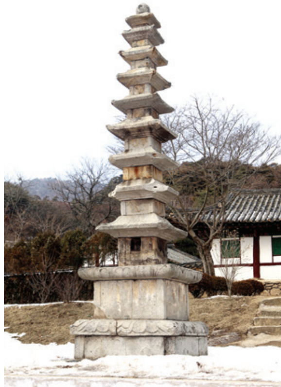
평안남도 평성 안국사 구층석탑