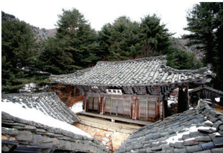
자강도 만수암 대웅전 전경

이사장 자승 스님은 "책은 북한 전통사찰에 대한 '최초의 종합보고서'라며 "북한 전통사찰의 현황을 정확히 파악하고 남북 불교 교류의 방향을 모색하는데 중요한 자료가 될 것"이라고 말했다.