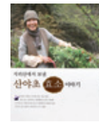
지리산에서 보낸 산야초 효소 이야기 전문희 저음 | 김선규 사진 | 이른아침 펴냄 | 1만5000원

암환자, 성인병환자가 급증하고 있다. 우리나라 암환자 수는 이미 70만 명을 넘어선 상태다. 암 외에도 세계 곳곳에는 병명이 밝혀지지 않은 질환들이 늘어나고 있다.