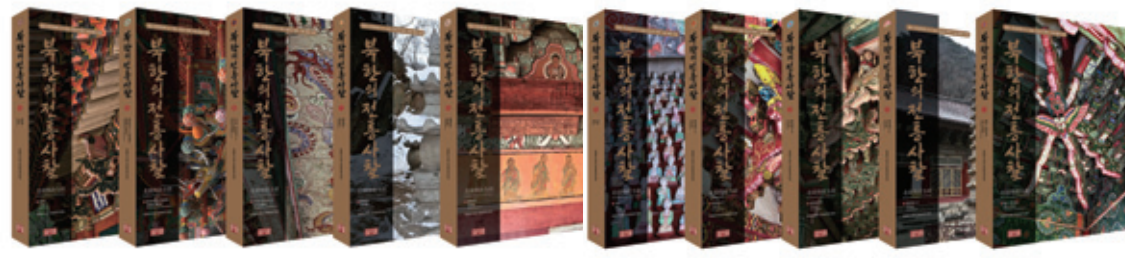
북한의 전통사찰 | 조계종 민족공동체추진본부 | 양사재 펴냄 | 전 10권 150만원

조계종 민족공동체추진본부, 국내 최초 자료 포함한 '북한의 전통사찰' 발간