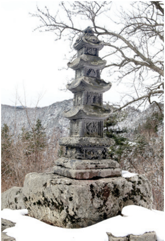
자강도 범방대 다층탑