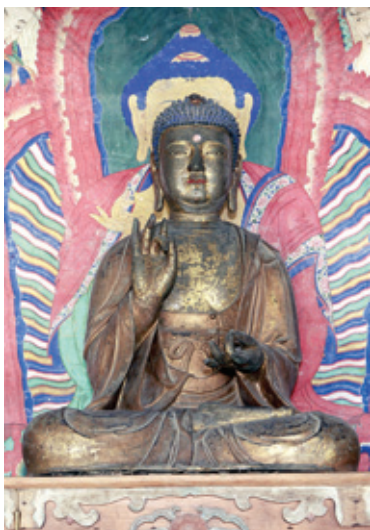
평남 평원 법흥사 금동여래좌상