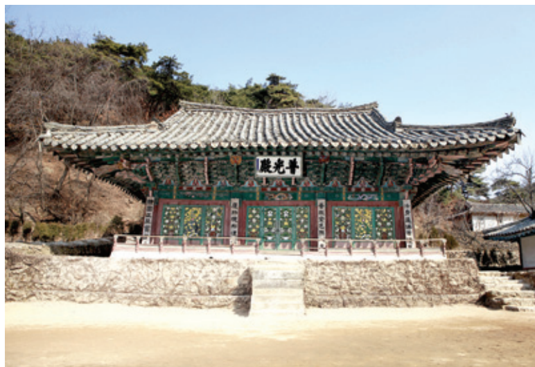
평안북도 박천 심원사 보광사

남북 분단 이후 갈 수 없고 볼 수 없었던 북한의 전통사찰이 모여져 도록으로 발간됐다.