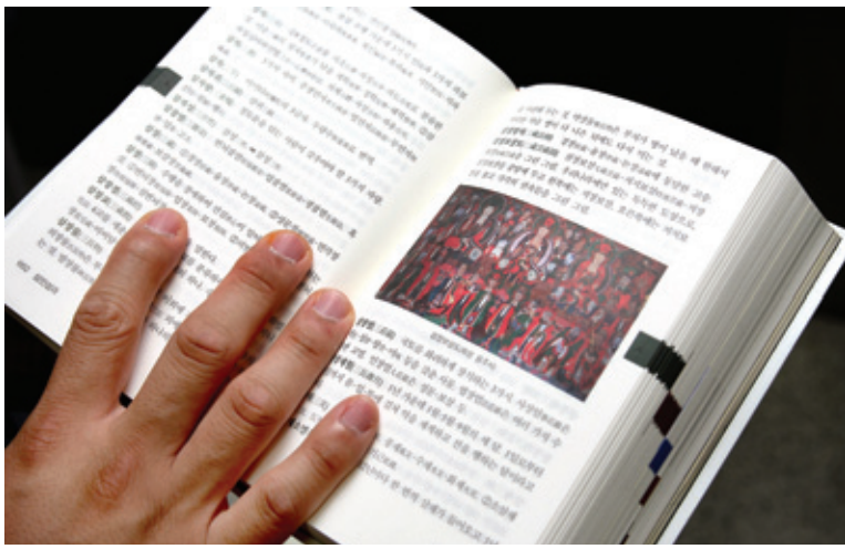
백과사전 같은 화려한 컬러로 1만5572여 항목에 달하는 표제어와 300여 장의 사진과 도면을 실은 <알기쉬운 불교용어 산책>

수룩했다. <콘사이스판 불교사전>은 국내 최초의 콘사이스판 불교사전이다. 주황색 고급 양장본으로 고급스럽다. 책을 펴면 불교 전반의 지식을 모두 한글로 상세히 설명했을 뿐만 아니라 단어의 개념을 영어로 요약 표기해 독자의 이해를 높였다.