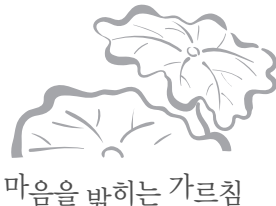
마음을 밝히는 가르침

대행스님 법훈록 그냥 무조건이야 양장본 / 211쪽 / 값 11,000원