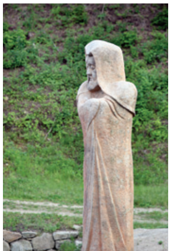
절입구 연못의 달마 스님 입상