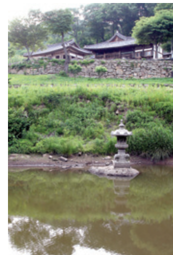
연못에 비친 운부암 전경