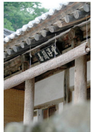
운부암 선원 운부난야