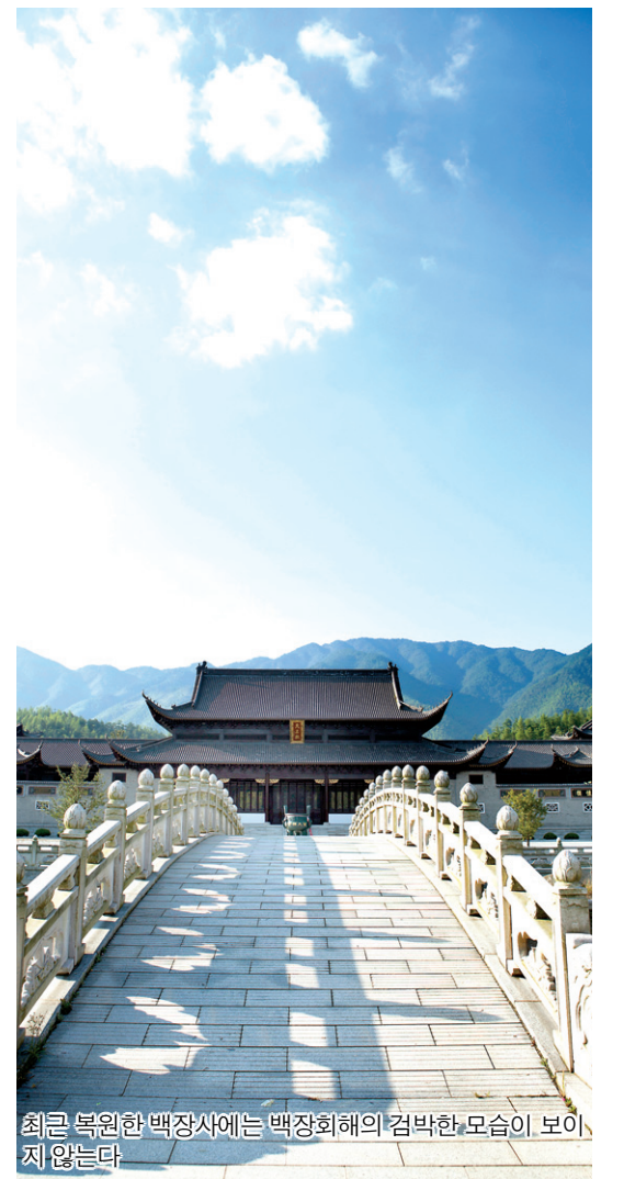
최근 복원한 백장사에는 백장회해의 겸박한 모습도 보이지 않는다