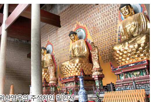
위산영우의 주석처인 밀인사

종과 선종, 송 선종과 휘종, 청 순치·옹정·건륭·도광 등의 황제가 칙서를 내렸고 근대에는 모택동 주석이 밀인사를 찾아와 밀인사 주지와 3일 밤낮을 토론해 ‘구국구민(救國救民)은大本대원(大本大源: 농민)에서 찾아야 한다’는 것을 깨달았다고 한다.