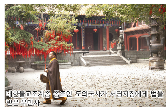
대한불교조계종 종조인 도의국사가 서당지장에게 법을 받은 우민사

조동종(曹洞宗)의 발상지 동산사는 개창조인 동산양개(807~869)가 가르침을 펴던 곳으로 현재 보리선사(菩提禪寺)로 불린다. 여름에는 시원하고 겨울에는 따뜻한 것 같은 길지에 자리잡고 있다. 물에 비