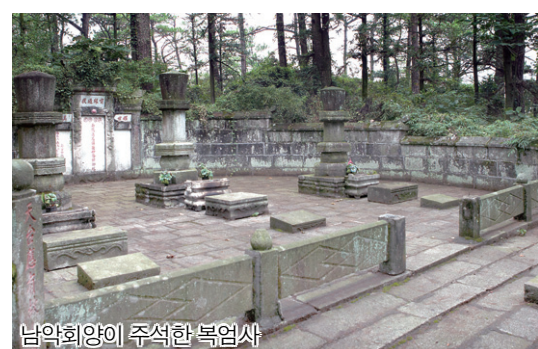
남약회양이 주석한 복엄사

복엄사에서 약 1km에 위치한 남대사에는 석두 희천(700~790)이 머물렀다. 복엄사에 주석하고 있던 회양과 남대사에 주석하고 있던 석두는 젊은 시자를 통해서 서로의 법을 드러내곤 했다. 남대사는 석두가 당나라 천보 초년(742)에 와서 수십 년 동안 주석하면서 법을 펴 행화도량이다. 중국 선종 5가 중에서 석두의 문하에서 조동종, 운문종, 범안종 3개 종파가 나왔다. 남대사 경내 동쪽에 큰 바위가 돌출돼 있는데 희천이 그 바위 머리에 작은 초암을 지어 오랫동안 주석한 까닭에 희천을 ‘석두’라고 부르게 된다. 실제로 남대사 동쪽 100여m쯤에 석두의 초암을 기리고 자 누각이 하나 지어져 있고, 그 안에 붉은 범의를 입힌 석두희천 석상이 있다.