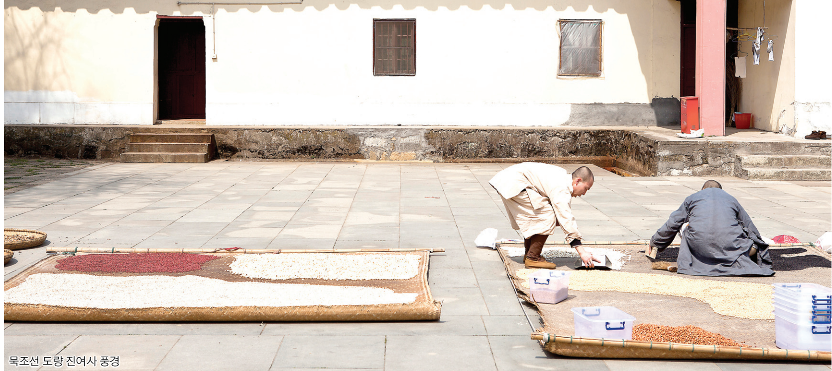
목조선 도량 진여사 풍경

마조의 원적도량인 보봉사에서 차로 한 시간 반 정도 이동하면 목조선 도량인 진여사가 있다. 진여사는 도용(道容)이 당 헌종 원하 3년(808)에 창건했다. 이후 동산양계의 제자 운거도응이 운거사를 찾아와 902년 입적할 때까지 30년 주지를 살면서 제2개산조가 됐다. 첫 이름이 운거사였다가 북송 때 진여선원으로 불리다가 문화혁명 이후 진여선사로 개명했다.