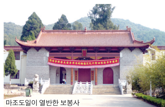
마조도일이 열명한 보봉사

동고현(洞高顯)에 위치한 백장사에는 백장회해(749~814)가 주석했다. 지금은 땅바닥에 흩린 쌀 한 톨까지 줌은 백장의 검박한 정신은 보이지 않는다. 백장은 <선원청규>를 제정해 선사와 율사 도량이 구분돼 발전했고, ‘일일부작 일일불식(一日不作 一日不食) 하루 일하지 않으면 하루 먹지 말라’는 농선(農禪)의 보청정신이 확립돼 황실이나 귀족의 후원, 탁발에 의지하지 않고 대중이 스스로 논밭을 개간해 자립의 기반을 다졌다. ‘날리 청한다’는 보청(普請)은 율력처럼 누구나 예외없이 노동에 참여한다는 뜻으로 당시 백장선의 요체가 됐다. 최근 복원한 백장사에서는 옛 절집 백장사의 모습을 볼 수 있다.