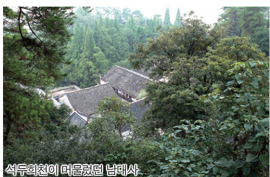
석두희천이 머물렀던 남대사

양산혜적(807~883)의 행화도량인 서은사는 장수성 의춘(宜春)에서 30km 거리에 있다. 선종 오가(五家) 중 임제종, 조동종, 위양종이 의춘의 황벽사, 동