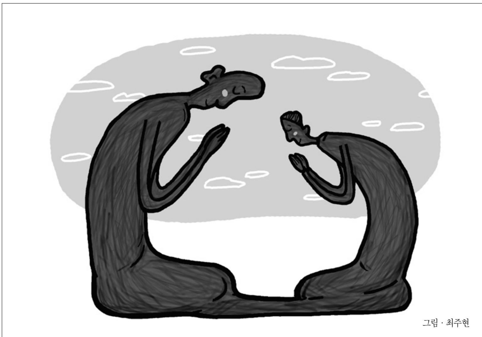
그림 · 최주현

사생자부(四生慈父)라고 하는 그 뜻도 역시, 항상 들어서 아시다시피, 태로 낳고 알로 낳고 화(化)해서 낳고 질척한 데서 낳고 하는 사생들을 모두 자기 아님이 없게 했다는 것입니다. 자기 모습 아닌 게 없이 했고, 자기 아픔 아닌 게 없이 했고, 자기와 더불어 같이 한도량에 있는 것을 제시했고, 또 모든 것을 돌이키고 흡수해서 인연을 지으셨으니 내 자식 아님이 없고 내 부모 아님이 없고 내 형제 아님이 없는 겁니다.