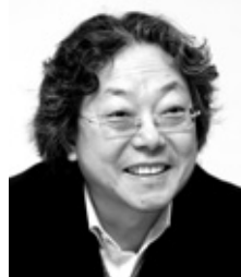
(서예가·동아미술상 수상 작가)