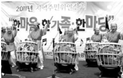
공연을 이어졌다. 행사 후에는 송광종합사회복지관 증축공사 준공식도 열렸다.

행사는 11시 식전공연을 시작으로 지역주민들에게 감사패와 각종 상이 수여됐다. 2부에서는 사물놀이, 모듬북, 민요, 통기타