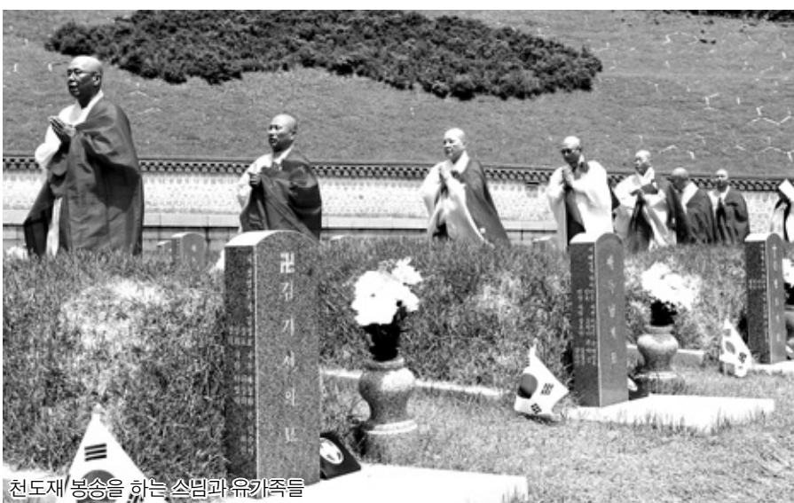
천도제 봉송을 하는 스님과 유가족들

이에 앞서 15일에도 광주전남불교환경연대 주최로 망월동 구묘역에서 작은음악회가 진행됐다. '꽃진 자리 피어나는 희