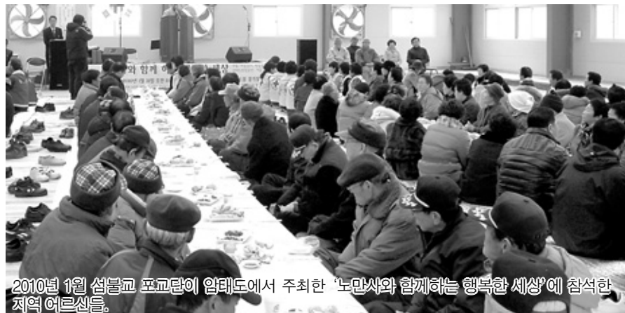
2010년 1월 섬불교 포교단이 암태도에서 주최한 '노만사와 함께하는 행복한 세상'에 참석한 지역 어르신들.

현재 우리나라 400여 유인도에는 600여 교회가 분포된 것으로 알려져 있다. 그러나 사찰의 경우 구체적인 통계가 없다.