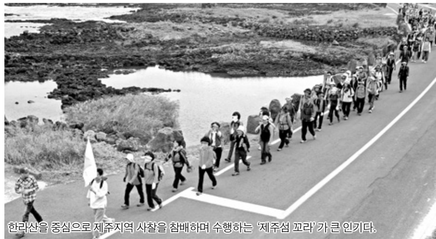
한라산을 중심으로 제주지역 사찰을 참배하며 수행하는 '제주섬 꼬라'가 큰 인기가 있다.

제주 불교의 주요 이슈는 타 종교단체에 비해 열세였던 불교계 복지시설의 약진과 도내 불교계의 법인 등록을 통한 체계적인 사업 추진이다.