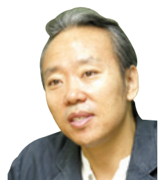
한국화가(동국대 미술학부 겸임교수)

누군가를 위해 꽃 한송이를 받칠 수 있는 넉넉한 마음 지닐 수 있기를 기도합니다. 누군가를 위해 향기로운 마음 나눌 수 있기를 기도합니다. 누군가를 위해 더 멀리 날 수 있기를 기도합니다. 누군가를 위해 살아갈 수 있기를 기도합니다.