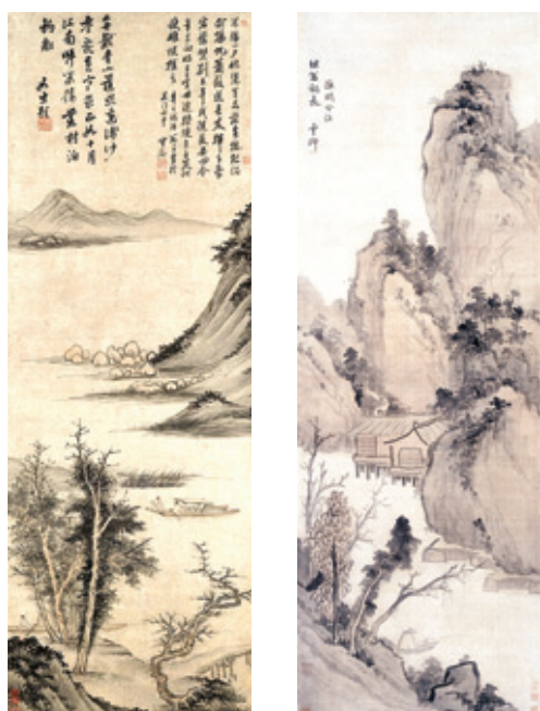
중국 명나라 후기의 서화가인 막시룡(莫是龍, 1539~1589)의 동강조수도 계열 그림이다.

한국화의 산수화 중 70%에 해당하는 그림들은 동강조수도 계열이다. 동강조수도란 제(齊)나라의 시조인 강태공을 주인공으로 하는 그림이다. 강태공은 주(周)나라 초기의 정치가이자 공신이며, 무왕을 도와 은나라를 멸망시켜 천하를 평정한 인물이다.