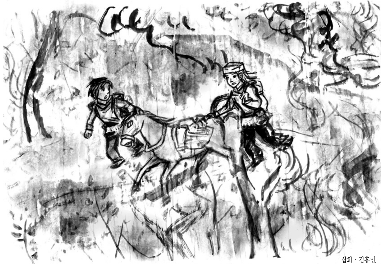
삽화 · 김홍인

“나 도대체 얼마나 잔거야? 해독제는? 주문은?” 정신을 차린 무니가 난다를 향해 거침없이 질문을 퍼붓기 시작했다. “그, 그게…….” 당장이라도 무니를 견어할 거 같은 기세는 어디로 가고 난다의 목소리는 점점 기어올라갔다.