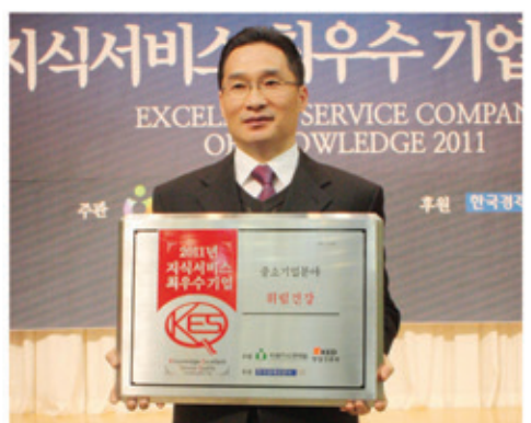
▲2011년 지식서비스 최우수기업 선정 사진

계좌번호: 국민 404601-01-046107 예금주 (주)휘림건강 판매원, 제조원: (주)휘림건강 * 대리점, 취급점, 영업사원모집