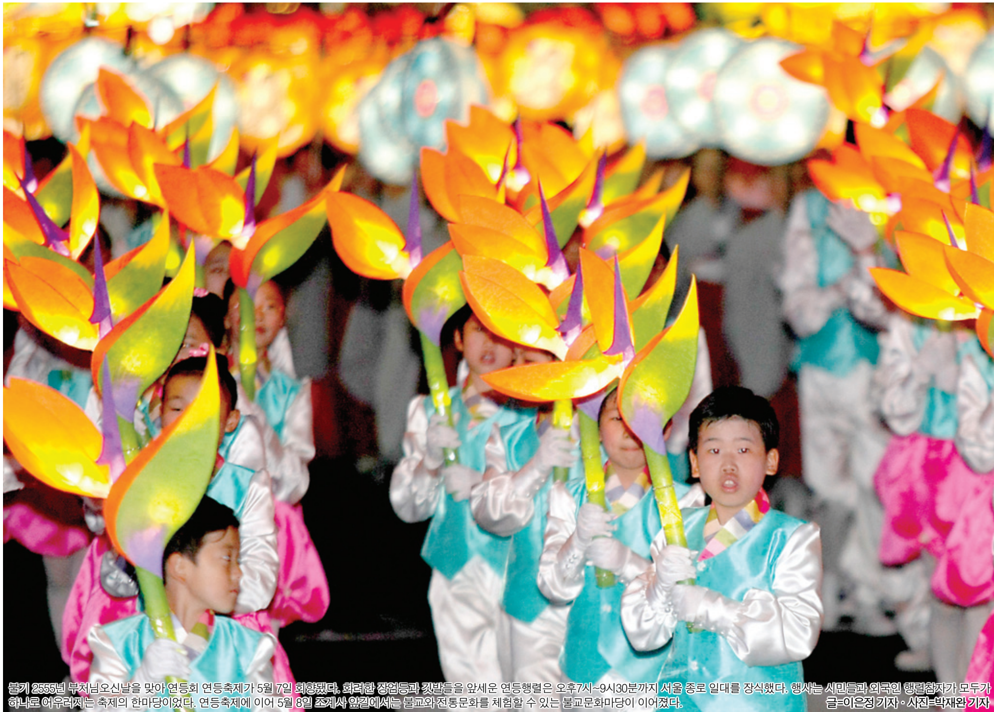
불기 2555년 부처님오신날을 맞아 연등회 연등축제가 5월 7일 회령에서, 화려한 장엄등과 깃발들을 앞세운 연등행렬은 오후 7시~9시 30분까지 서울 종로 일대를 장식했다. 행차는 시민들과 외국인 관광객까지 모두가 하나로 어울리는 축제의 한마당이였다. 연등축제가 이어 5월 8일 조계사 앞길에서는 불교와 전통문화를 체험할 수 있는 불교문화마당이 이어졌다.