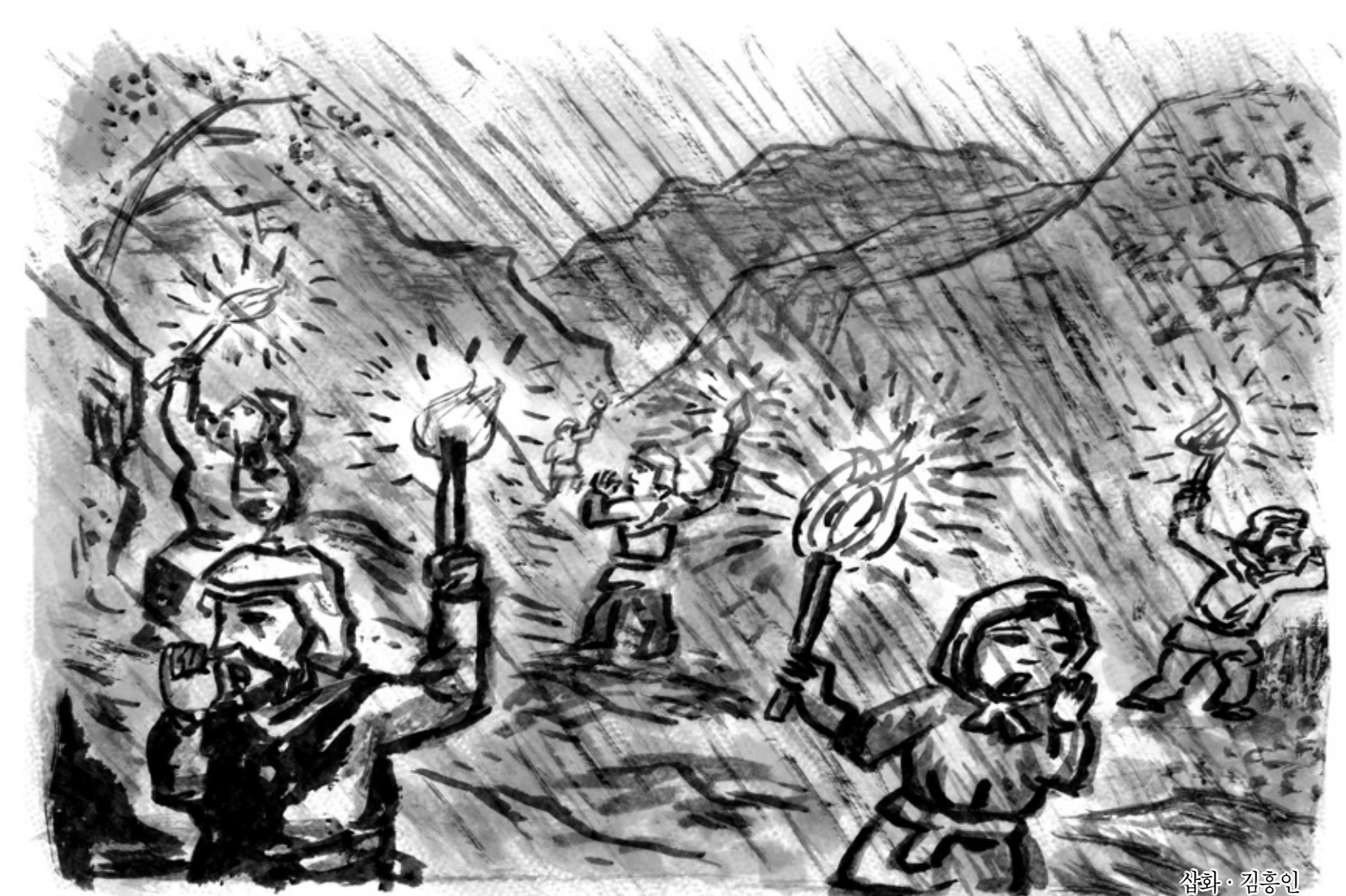
선화 · 김홍인

하지만 정작 아이들이 발견된 곳은 유리 영감의 오두막 앞이었다. 그 옆에는 칸타카 역시 지친 모습으