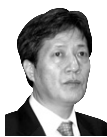
김영국 칼럼 前 조계종 총무원장 정책특보