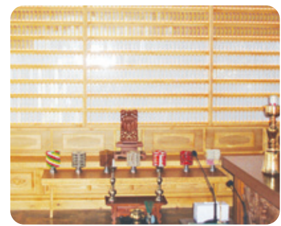
용학사 목련관 위패