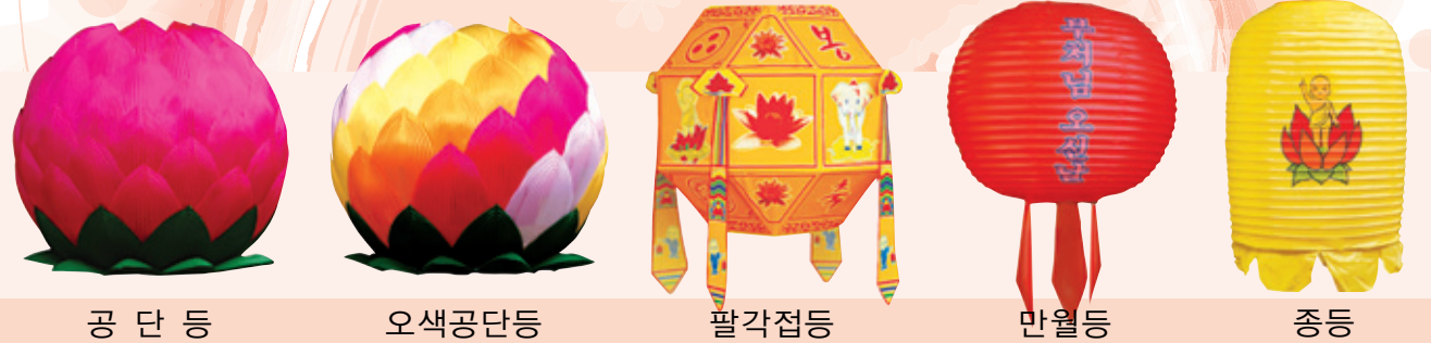
공 단 등 오색공단등 팔각접등 만월등 종등