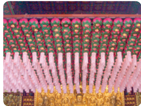
연등 자동 승강장치 - 도선사