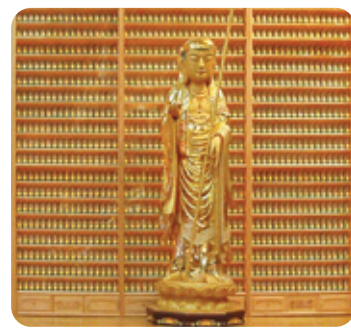
마산 금강정토사 LED인등