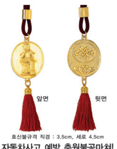
호신불규격 직경 : 3.5cm, 세로 4.5cm 자동차사고 예방 축원불공마쳐!

갑은 동서사방에서 복이 들어오게 하는 법구와 막혔던 모든 문제를 해결하게 하는 영험의 법구가 들어있으며 음양의 조화로 원하는 소원이 성취되게 왕진언이 지갑 앞면에 들어있다. 소재는 고급소가죽으로 되어 있으며 일반 지갑과는 비교될 수도 없게 내부도 잘 꾸며져 있고 사용하는 중생이 급전의 고통에서 빨리 벗어나 평생 부자로 살게 축원 불공을 마친 복지갑으로 선물로도 뜻깊은 선물이 될 것이다. 남성용 반지갑 65,000원, 여성용장지갑 95,000원 전화로 신청하시면 택배로 보내 드립니다. (신용카드 분할가) 전화 : (02)741-4488 (일요일, 공휴일도 상담) 동협계좌 : 032-12-193445 이상하