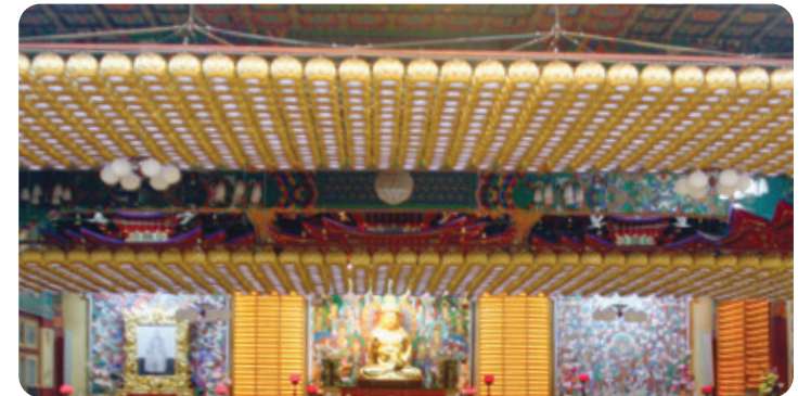
연등 자동 승강장치 - 안산 월장사

찬덕연등에서는 KS케이블 을 사용하여 가장 안전하게 전문 기술인에 의해 직접 감독 시공 합니다.