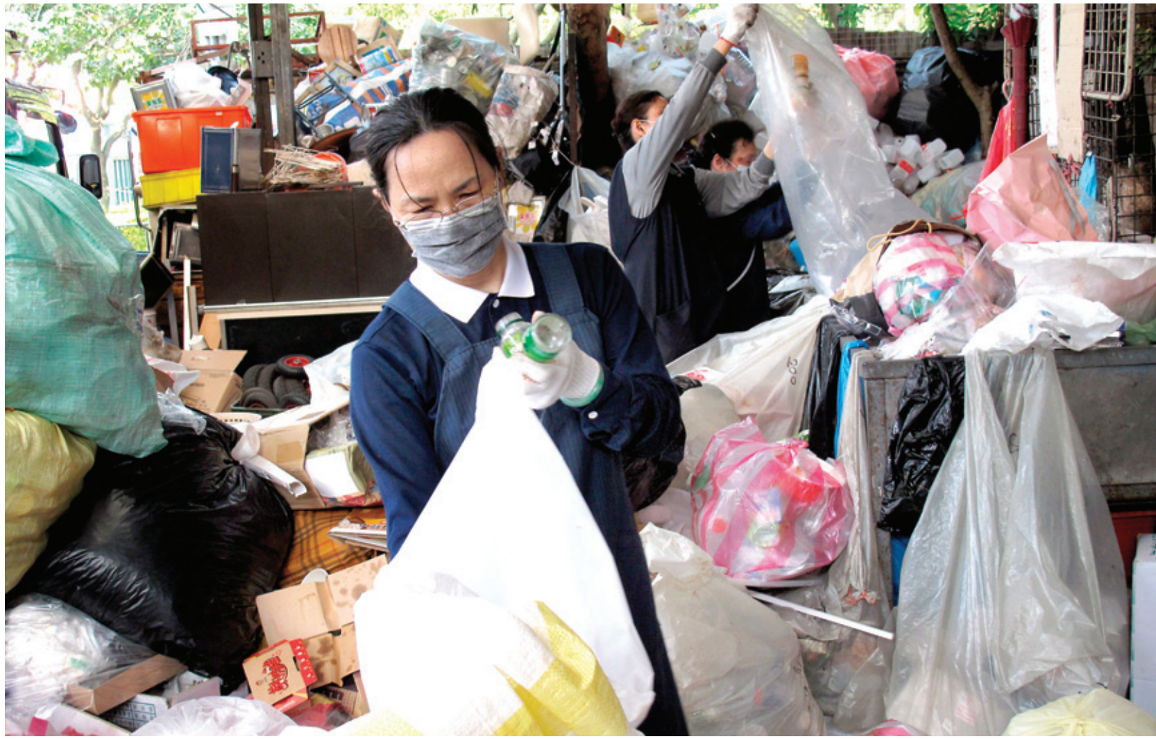
자제공덕회 자원봉사자들이 도시 내에 자리한 환경보호센터에서 봉사활동을 펼치고 있다. 일일이 색색으로 분리 수거된 단추, 플라스틱 생수병은 폴리스터 섬유로 된 담요와 의복 등으로 재활용돼 재난 지역에 보내진다. 자제공덕회는 또 자원 재활용으로 발생하는 수익으로 불교계이불 TV를 운영하고 있다.

자제공덕회는 대만에서 규모가 가장 큰 민간자선 기구로 전 세계에 지부와 연락사무소를 갖고 있다. 33개국에 자제공덕회 사무소를 설립하고 있으며 38 개 국가에 183개 지부가 있다. 자제공덕회 회원은 400여 만명에 이르며 2010년 예산만 해도 6000여 억원에 달한다.