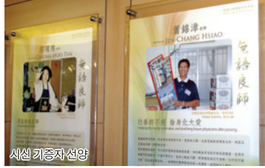
시신 기증자 선양

*불교서적총판 운주사는 양질의 불서를 보급하는 데 최선을 다하고 있습니다.