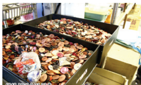
색색 분리수거된 단추