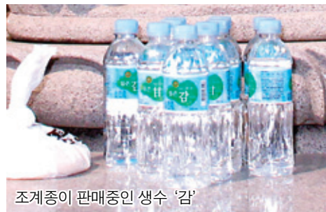
조계종이 판매중인 생수 '감'

종단이 지속적인 개선 요구를 받아온 수익 사업에 대해 법인화에 무게를 두고 내부 검토 중인 것으로 알려졌다. 수익사업이 외면할 수 없는 과제라면 법인화를 통한 사업 다각화로 신도 등 불교계 내부 판매에 대한 의존을 줄이고 일반 소비자들에게 적극적으로 다가갈 수 있는 방안이 있다.