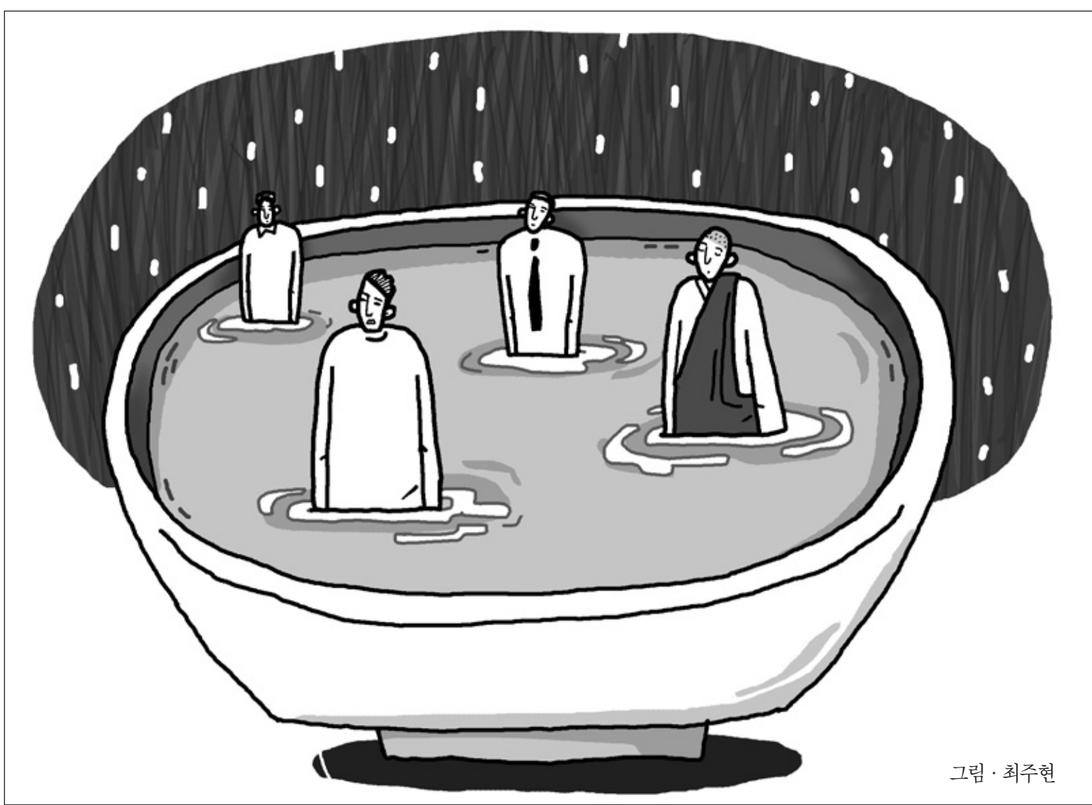
그림 · 최주현

우리가 생활할 때 항상 주인공, 나의 불성 뿌리에 다가 모든 것을 놓으라고 하죠. 좋은 것은 감사하게 놓고, 안좋은 것은 '안짱지 않게 하는 것도 너' 라고 놓고, 그렇게 오싹통을 잘 굴리라고 했습니다. 오싹통은 누구냐가 다 가지고 있는 겁니다. 보는 거, 듣는 거, 말하는 거, 가고 오는 거, 또 내가 어디서 나온 걸 아는 거 말입니다. 또 상대성을 알고 말입니다. 그러니까 다섯 가지의 문채를 볼 때에 거기서 나오는 모두를 거가다 놓되, 두 가지 여건이 있습니다. 하나는 감사하게 놓고, 하나는 구경물도 거가서 나오는 거니까 거기서 맑은 물로 대치할 수가 있다는 믿음으로 놓으라는 얘깁니다.