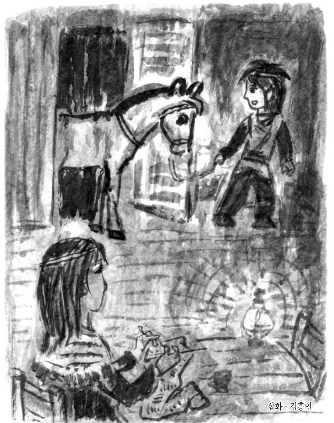
삽화 · 김홍인

눈이 조금씩 내리기 시작했다. 촛장은 집 앞에 나와 아무 것도 없는 캄캄한 밤하늘을 쳐다보고 있었다. 그름, 심어 낸 전 겨울 약초를 구한다며 나갔던 마야가 실종됐던 밤도 오늘처럼 짙을 같았다. 마을 사람들과 함께 누프르산 여기저기를 뒤지는 내내