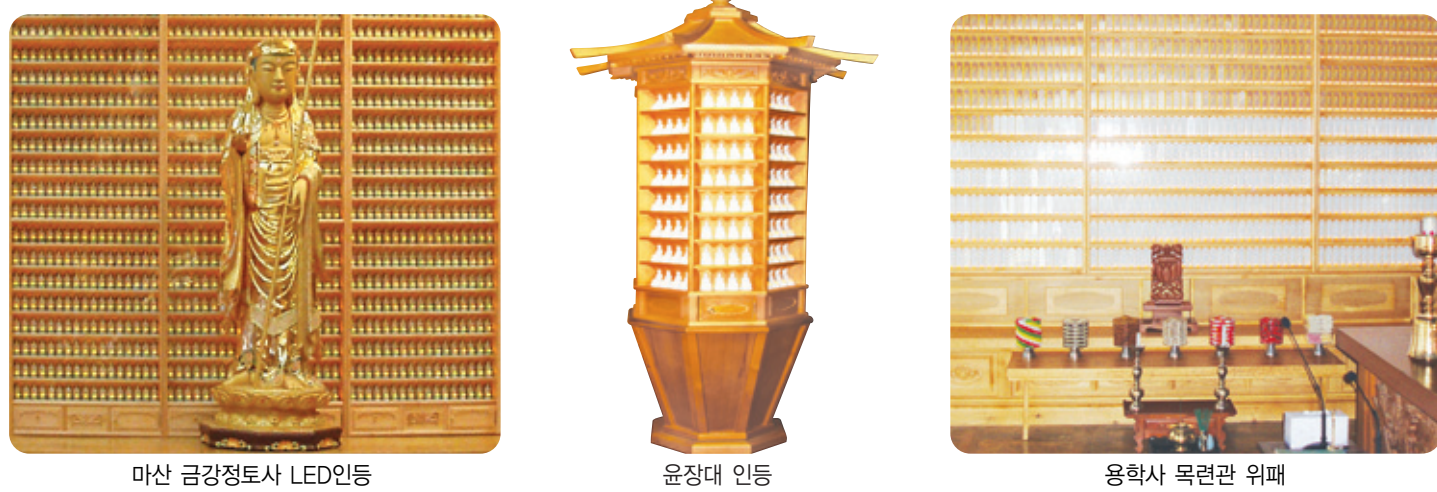
마산 금강정토사 LED인등 윤장대 인등 용학사 목련관 위패

전선(케이블) _ 연등승강장치 天上列車 ※ 이제는 법당 연등 설치도 버튼 하나로 해결하세요.