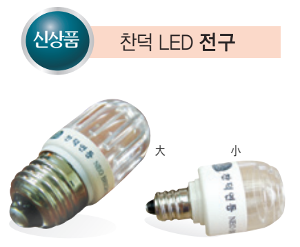
신상품 찬덕 LED 전구