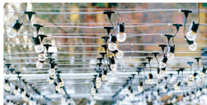
외부에 시공된 전선(케이블)

찬덕연등에서는 KS케이블을 사용하여 가장 안전하게 전문 기술인에 의해 직접 감독 시공합니다.