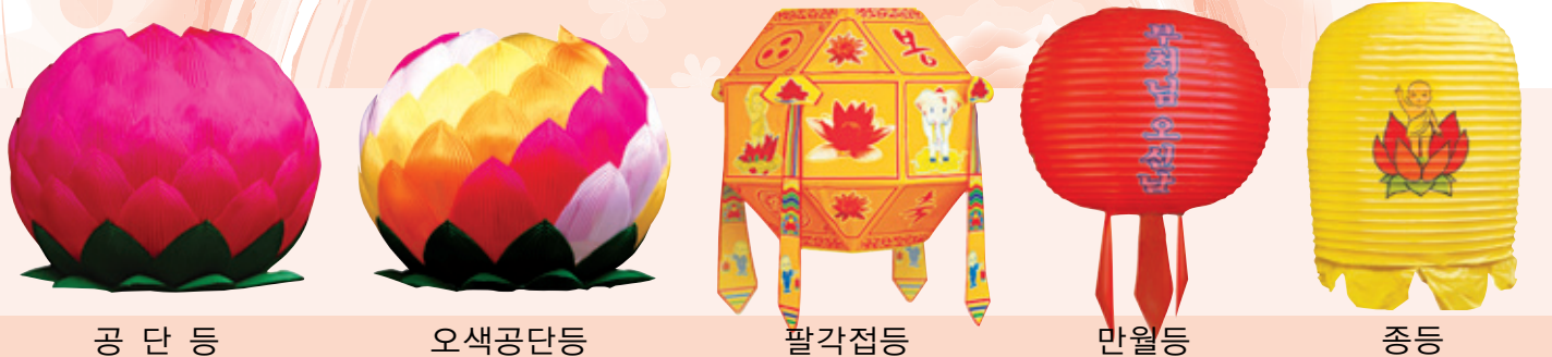
공 단 등 오색공단등 팔각접등 만월등 중등