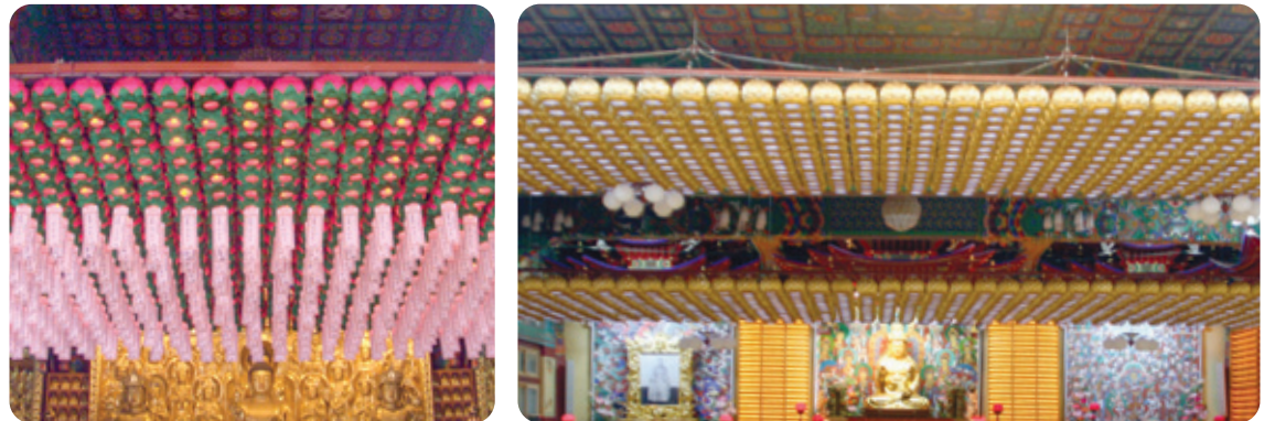
연등 자동 승강장치 _ 도선사 연등 자동 승강장치 _ 안산 월광사

전선(케이블) _ 연등승강장치 天上列車 ※ 이제는 법당 연등 설치도 버튼 하나로 해결하세요.