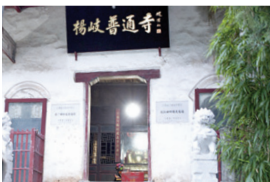
동아시아 선불교를 석권한 임제종의 주류가 된 양기사의 개창도량인 보통사(양기사)