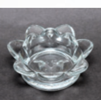
크리스탈 연꽃 받침대