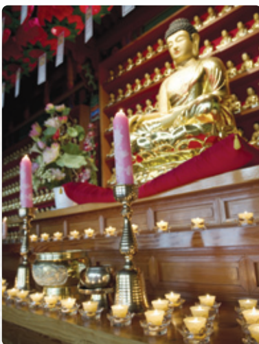
一人一燭 연꽃밑받초 배치모습

삼환양초에서는 법당에서 스님 및 여러 불자들이 부처님께 초 공양을 쉽게 올릴 수 있도록 신제품 1인1축 연꽃밑받초 를 개발하였습니다. 연꽃 모양의 크리스탈 받침대과 밑받초로 구성되어 있어 손쉽게 양초를 교체할 수 있도록 만든 신개념 제품입니다. 특히 특수PC컵을 이용하여 화재위험을 완벽하게 방지 하도록 설계되어 있어 법당 및 야외 어디서나 안전하게 초 공양을 올릴 수 있습니다. 이제 모든 불자들의 마음을 담아 법당에서 1인1축 연꽃밑받초로 초 공양을 할 수 있습니다.