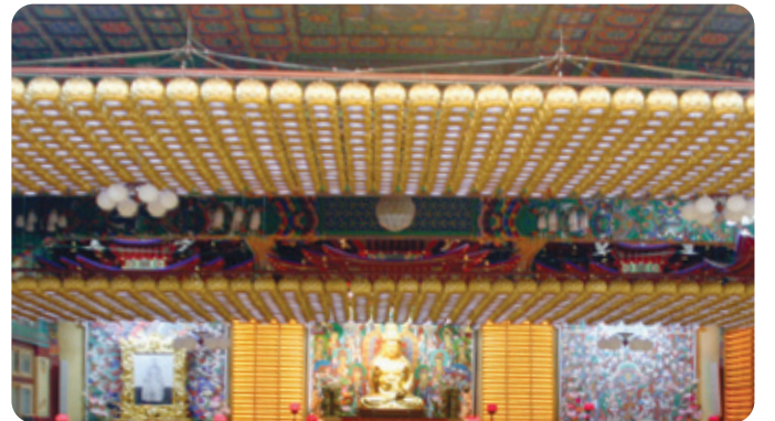
연등 자동 승강장치 - 안산 월광사

연등승강 장치인 찬덕불교가 신개념 기술로 개발하여 기술특허(연등승강 장치 10-0774542호)를 획득한 장치입니다. 이 기술을 모르는 일부 업체에서는 연등승강장치에 대한 모방 및 비방을 하고 다니는 사례가 발생하고 있습니다. 이에 찬덕불교는 모방 및 비방하는 업체에 대해 강력한 법적 책임을 지도록 할 것임을 밝혀 둡니다.