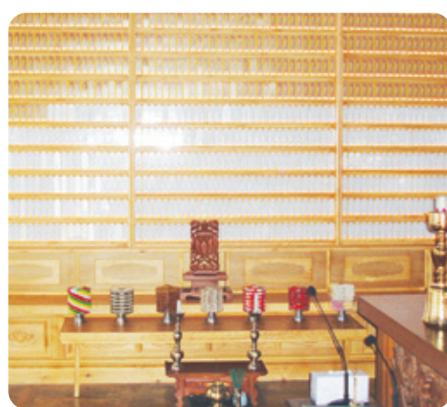
용학사 목련관 위패