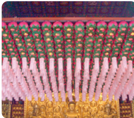
연등 자동 승강장치 - 도선사