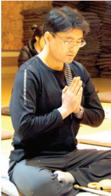
선우아침기도모임의 청년불자들의 열정적인 기도 모습

“관세음보살, 관세음보살, 관세음보살...” 춘분을 하루 앞둔 3월 20일 새벽 6시, 10여 청년들의 우렁찬 관세음보살 경근 소리가 부산 법계정사 법당의 차가운 새벽공기를 가른다. 대한불교청년회 부산지구(회장 하재