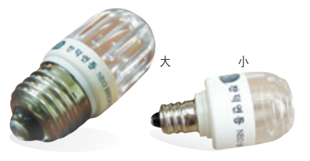
1년 365일, 하루 6시간 사용 전기요금: 98원/1kwh

※ LED 전구: ● 기존 전기요금의 10% 정도가 소요 ● 열 발산이 적어 화재의 위험성이 적음 ● 불빛이 사방으로 퍼져 화려한 밝기가 특징 ● 사찰에서 원하는 규격에 맞추어 제작해 드립니다