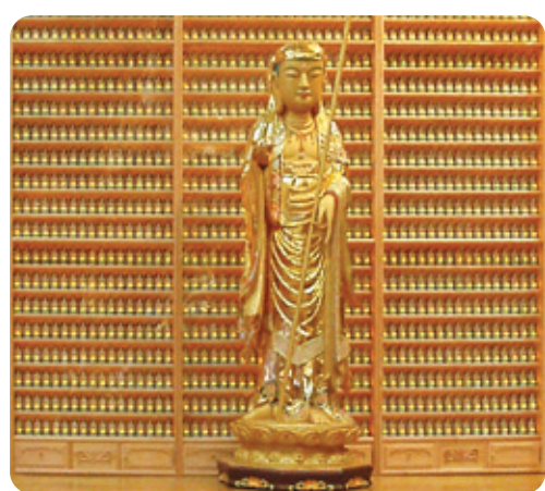
마산 금강정토사 LED인등