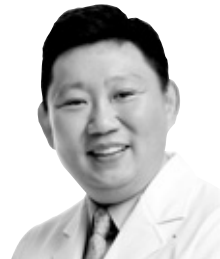
이경제 원장 래오 이경제한의원

우연히 보트여행을 즐기는 1896년의 르노와르 사진을 본 적이 있다. 손가락 관절이 부어있어 관절염이 있구나 싶었는데, 1903년 심각하게 손뼉틀림 증세가 급격히 진행된 사진을 보고 관심을 갖게 되었다. 나중에는 휠체어를 타게 되었고 스스로 붓을 쥐지 못해 주변사람들이 손에 붓을 고정시켜주고 팔레트를 무릎 위에 놓고 그림을 그리게 되었다. 정말 몽클랑 감동을 느꼈다. 르노와르의 병명은 류마티스 관절염이다. 한의학에서는 백호풍이라고 하는데, 표현하자면 호랑이에게 물린 정도라고 아픈 증상이다. 류마티스 관절염은 일반 관절염과 달리 자가면역 질환이다. 자기면역 질환은 내 몸속의 쿠데타