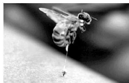
벌침은 관절염에 효과가 좋다.

로 만든 벌갑고, 당나귀 껍질로 만든 아교 등으로 구성된 관절의 특효약인 가미대교탕으로 관절염을 치료하고, 관절을 튼튼하게 할 것이다. 르노와르에게 고온건조한 파스프링으로 휴양할 것을 권유하겠다. 파스프링스에는 많은 관절염과 신경통 환자들이 요양을 하고 있다. 그 이유는 바로 따뜻하고 건조한 날씨 때문이다. 모든 관절염은 습기가 많고 추우면 증상이 심해진다. 그래서 장마철이 되면 온몸이 수시로 무거워진다. 퇴행성관절염이든 류마티스관절염이든 류마티스관절염을 앓고 있는 경우는 장마철에 증상이 더 악화된다. 그래서 몸을 따뜻하게 하고 축축한 곳을 피하는 것이 통증예방의 비결이고, 장마철 건강법이다.