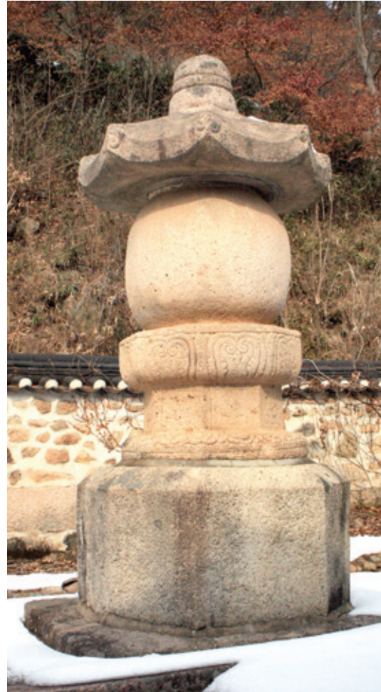
능인전 뒤뜰에 모셔진 세존사리탑.