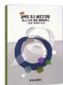
황토 삼백초 효소 발효관리법 부원출판사 | 정액권 | 값 5,000원

노화와 난치병을 이기는 삼백초의 놀라운 효능! 변비, 숙변, 생리통을 없애는 날마다 기분 좋은 건강 비결! 간질환, 당뇨, 신장질환, 동맥경화, 고혈압, 심장병, 부인병, 비만치료!