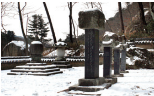
범주사 부도밭의 부도와 비들.

수정교를 건너는 동안 눈동자는 돌담 너머 상반신만 보이는 청동미륵대불에 고정됩니다. 미륵대불은 범주사의 상징입니다. 8세기 중엽 진표 율사(眞表律師 생몰미상)가 범주사를 중창한 사상적 배경이 미륵신앙이었습니다. <삼국유사>에 의하면 진표율사는 지극한 기도 끝에 미륵과 지장보살을 친견하고 교법을 전수 받았으며 금산사와 범주사를 차례로 중건했다고 합니다. 지금도 우리나라 미륵신앙의 대표적인 도량은 금산사와 범주사입니다.