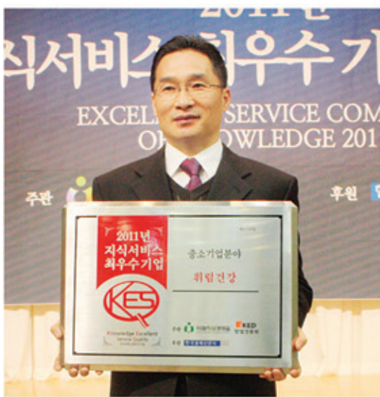
▲2011년 지식서비스 최우수기업 선정 사진

무릎찜질. 허리찜질. 족욕. 좌욕. 반신욕. 사우나. 한번에... OK!