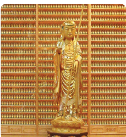
마산 금강정토사 LED 인등