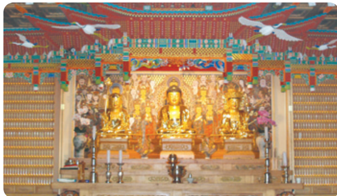
용학사 목련관 위패