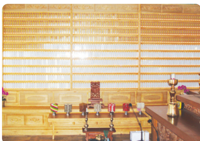
용학사 극락전 영구위패