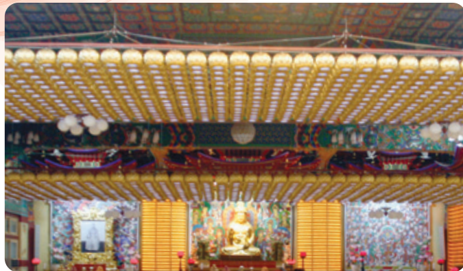
연등 자동 승강장치 _ 안산 월각사