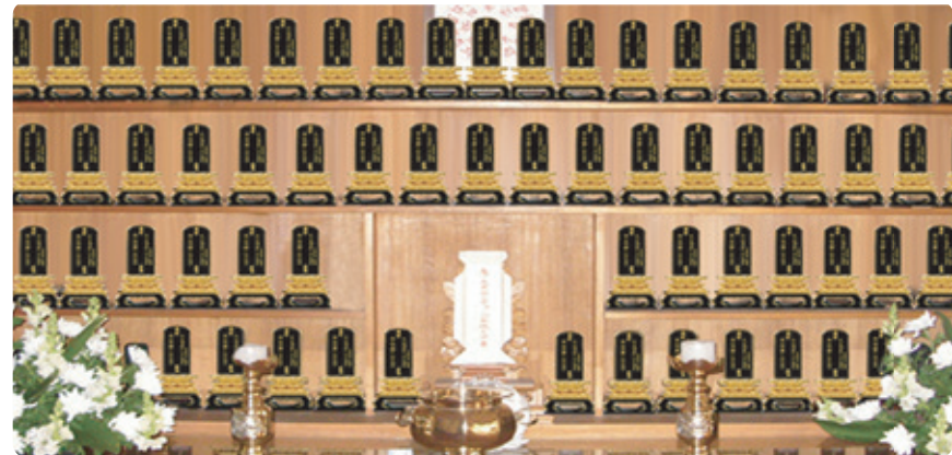
< 안치전경 >

◆ 하나 하나 수작업으로 정성을 다하여 제작한 황금위패로 영가위패단의 품격과 신도는 조상에 대한 숭모의 뜻을 높일 수 있습니다.