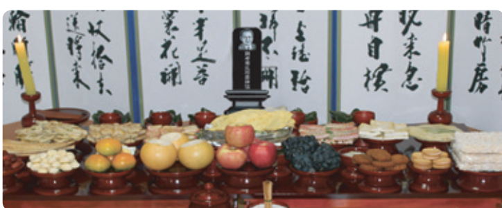
주문시 사진은 메일이나 우편으로 보내주시면 제작 후 택배로 보내드립니다.