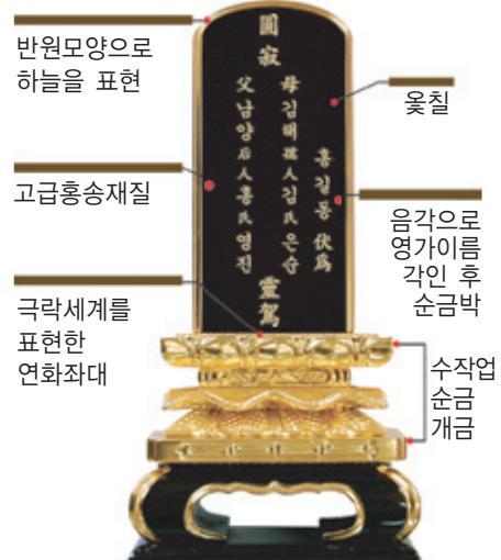
하나하나 정성을 다한 수작업 조각