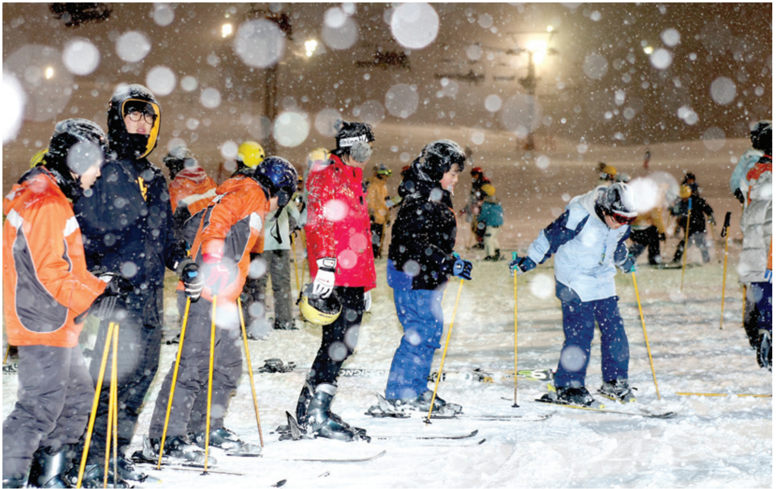
빨리 쌍성 달리고 싶은데...

파라미터청소년연합회(회장 도후)는 조계종 포교원, 화계사, 삼선포교원, 이대청소년놀이연구회와 함께 1월 22일 인제군 만해마을과 횡성 현대성우리조트에서 '제1회 전국사찰청소년연합수련회'를 개최했다. 전국의 사찰학생회 구성원들간의 화합과 교류를 위해 마련된 이번 수련회에는 150여 청소년이 참가해 2박 3일 동안 일정을 보냈다. 사진은 행사 이틀째인 23일 청소년들이 현대성우리조트에서 스키를 타기에 앞서 기본 강박재원 기자