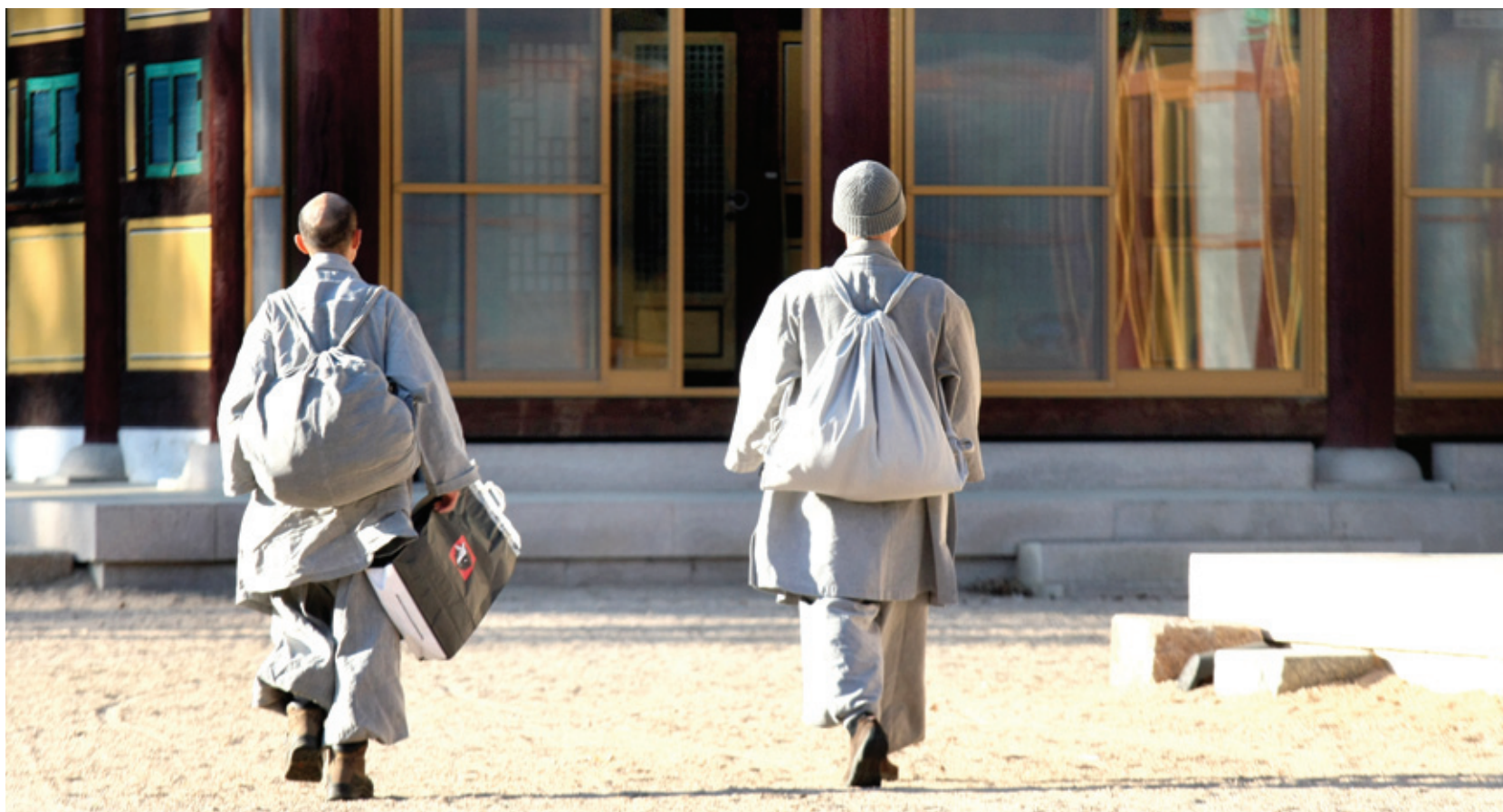
법주사 총지선원의 2010년 동안거 입재 때 스님들이 입방하고 있다.

이 나가서 안내했는데, 그와 같은 것이다. 이어 신도(입방승)가 먼저 "오래부터 도풍이 울려 퍼지니 이곳 한 쪽에서 머물고자 합니다. 자비를 바랍니다"라고 하면, 유나는 "광림(光臨)함을 입어서 산문(山門)으로서는 다행한 일입니다"라고 응대한다. 이어 각자 서류를 넣은 사부통을 내밀면 유나스님은 일일이 확인한다. 특히 도첩과 면정유는 의식이 날 경우 지방 관아까지 연락해 확인했다. 이 두 서류가 가장 까짜가 많았기 때문이다.