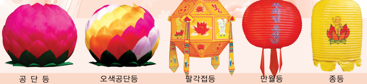
공 단 등, 오색공단등, 팔각점등, 만월등, 종등

찬덕연등이 개발한 새로운 개념의 신상품 영구위패 · LED인등 · LED전구