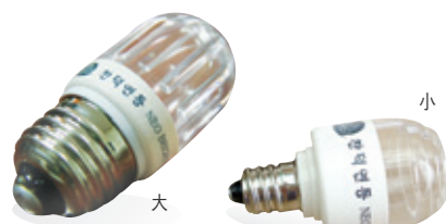
1년 365일, 하루 6시간 사용 전기요금: 98원/kwh