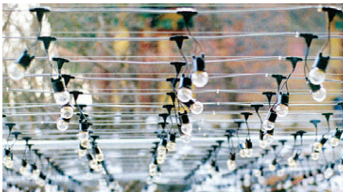
외부에 시공된 전선(케이블)

찬덕연등에서는 KS케이블을 사용하여 가장 안전하게 전문 기술인에 의해 직접 감독 시공합니다.