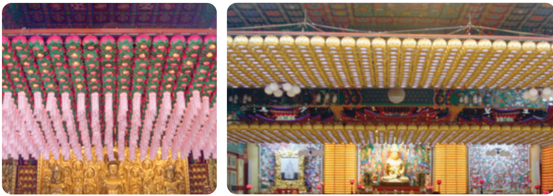
연등 자동 승강장치 - 도선사, 연등 자동 승강장치 - 안산 월강사

찬덕연등에서는 KS케이블을 사용하여 가장 안전하게 전문 기술인에 의해 직접 감독 시공합니다.