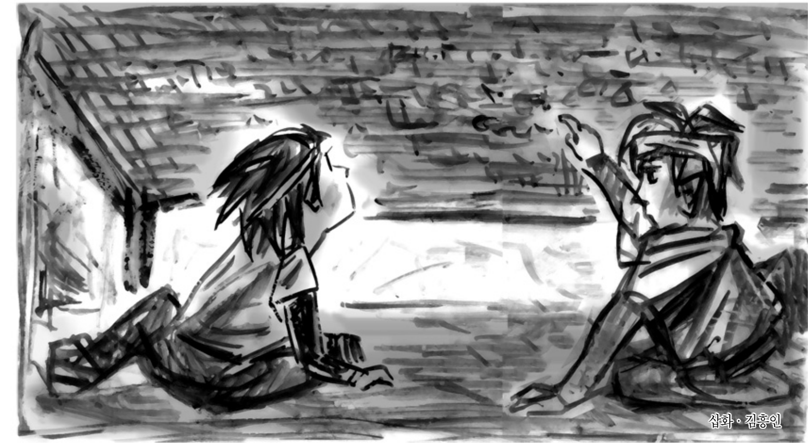
삽화 · 김홍인