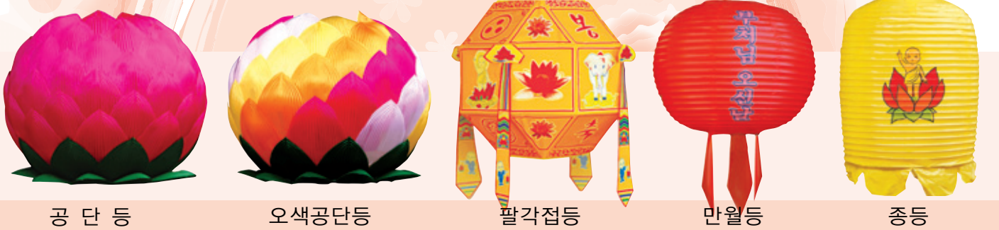
공 단 등 오색공단등 팔각접등 만월등 종등