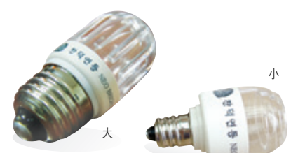
1년 365일, 하루 6시간 사용 전기요금: 96원/1kwh