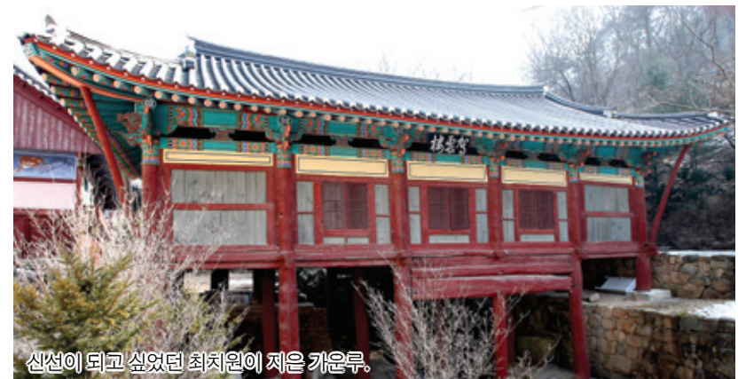
선원이 되고 싶었던 최치원이 지은 가운루.

도량 위쪽에 선원이 있다. 큰법당 그림자만큼 돌계단을 오르면 귀가 많이 떨어 지나간 삼층석탑과 나한전이 있고, 그 옆이 선원이다. 산기슭에 달아있는 마당 끝에 서면 햇살 쪽으로 목을 빼고 선 소나무들이 만져질 것만 같다. 동안개가 끝나간다. 한 겹 창호지 문살로 봉인된 공안들이 궁궁하다. 며칠 뒤면 그 봉인을 뜯게 된다. 겨울바람이 문살을 두드리고, 나한전 마당의 낙엽들이 살금살금 선원으로 굴러간다. 갈 길을 정하지 못했던 낙엽들이 이제 갈 길을 정한 것 같다. 아래 큰법당의 법회가 끝났다.