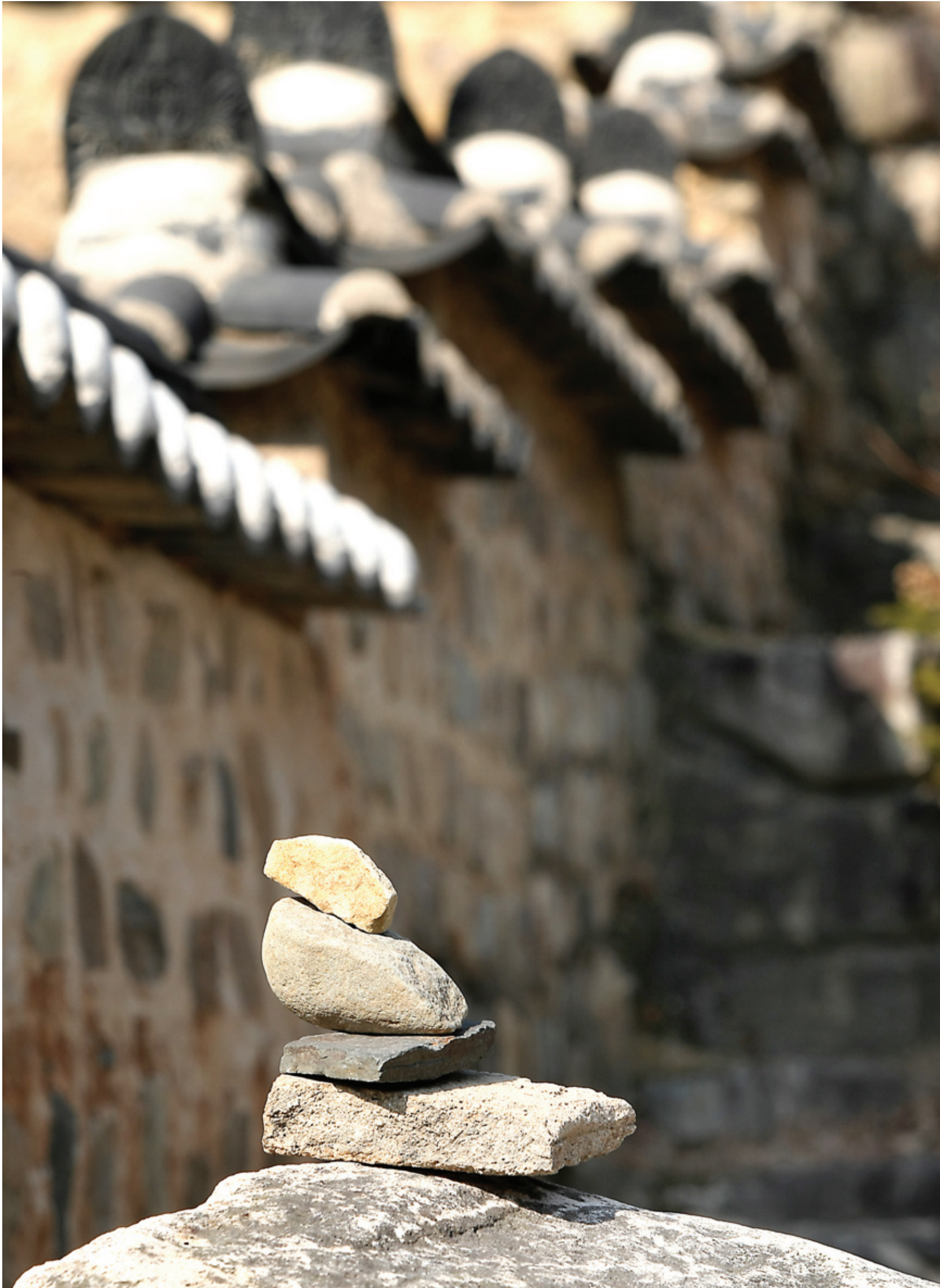
누군가 연수전 돌담 밑에 쌓아놓은 불상 모양의 돌담.