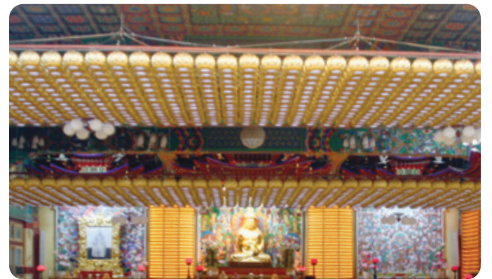
연등 자동 승강장치 _ 안산 월강사

찬덕연등에서는 KS케이블을 사용하여 가장 안전하게 전문 기술인에 의해 직접 감독 시공합니다.