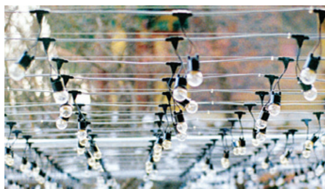
외부에 시공된 전선(케이블)

찬덕연등에서는 KS케이블을 사용하여 가장 안전하게 전문 기술인에 의해 직접 감독 시공합니다.