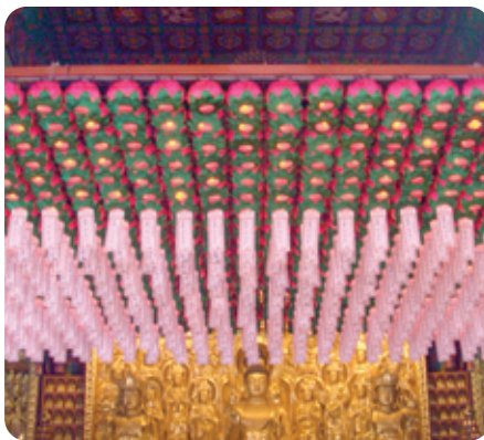
연등 자동 승강장치 _ 도선사