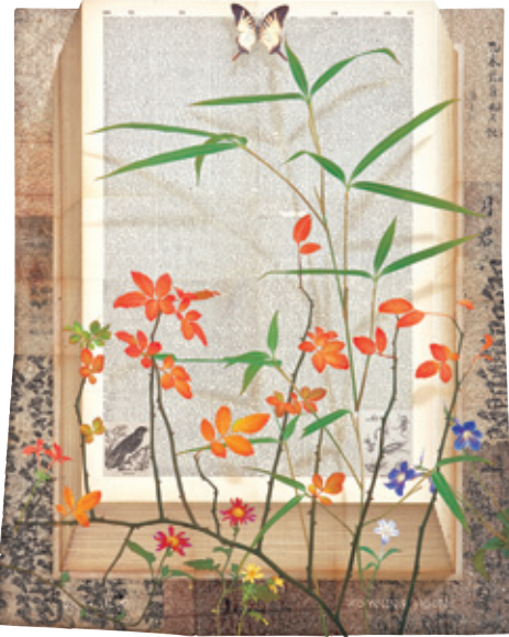
“내려갈 때 / 보았네 / 올라갈 때 / 보지 못한 / 그 꽃”

고은 시인의 작품 ‘그 꽃’이 캔트지 위에서 한 떨기 꽃으로 재탄생 됐다. 꽃잎이 금방이라도 떨어지고, 나비가 날아다닐 것 같은 이 작품(사진)은 고영훈 화백의 ‘그 꽃’이란 작품이다.