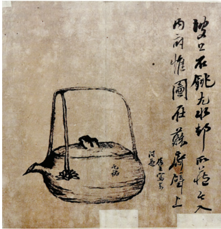
초의 선사가 유독공의 아들 유불학에게 보내 준 그림. 파공석조도(坡公石鑄圖).

화봉궐리리는 이런 초의 선사에 대한 의문 해소와 존재를 알리기 위해 ‘명선 초의전(茗禪 草衣展)’을 개최했다. 이번 전시에는 초의의 유묵과 저술, 소장 도서, 그와 교류했던 인물들의 간찰 등이 전시의 주를 이루며, 대부분 자본 목서가 전시품의 대부분을 차지한다.